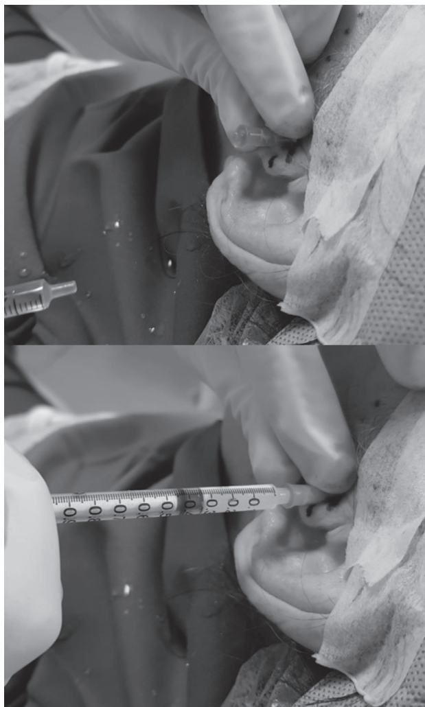
Fig. 3. Lavado articular de ATM izquierda y medicación intrarticular con metilprednisolona.

Al cabo de la cuarta semana de tratamiento, la paciente se encontraba consumiendo 400 mg de CBZ día, no utilizando analgesia de rescate, y el dolor facial persistente había reducido su intensidad de forma considerable. La basal dolorosa disminuyó de una intensidad 8-9 a 2-3, con focos persistentes de dolor intermitente de carácter tenso/opresivo correspondientes al dolor miofascial maseterino y la tendinitis del temporal. Se adicionó 12,5 mg de amitriptilina cada 24 horas por un periodo de 6 meses, y se realizó bloqueo de los puntos gatillos residuales y del tendón del temporal con una mezcla de dexametasona/mepivacaina/lidocaína. Con ello se logró disminuir el dolor facial residual y establecer una dosis de CBZ 400 mg/día con paroxismos neurálgicos ocasionales y de poca intensidad durante los 6 meses siguientes.