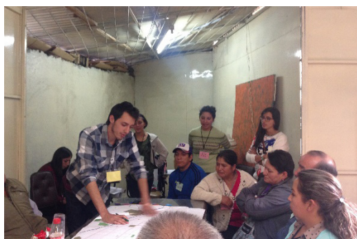
Figura 4: Ciudadanos trabajando en los talleres.