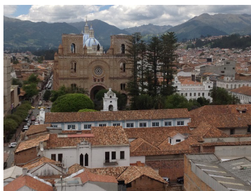
Figura 1: Frontis de la Catedral Nueva de Santa Ana de los Ríos de Cuenca, Ecuador (2015).

Debido a su aislamiento geográfico, Cuenca mantuvo su perfil urbano hasta 1950. Sin embargo, la presión ejercida por la promoción inmobiliaria y las nuevas demandas sociales agilizaron la expansión urbana y una serie de transformaciones significativas en la ciudad. En 1982 se elabora el Plan de Desarrollo Urbano para el Área Metropolitana de Cuenca para salvaguardar la imagen de la ciudad y restaurar varios edificios (CONSULPLAN, 1982; IMC, 2011). En 1999 el centro histórico de Cuenca es incluido en la Lista del Patrimonio Mundial de la Unesco, incluyendo el territorio que ocupó la ciudad de Cuenca en la primera mitad del siglo XX, el sitio arqueológico de Pumapungo y el acceso al camino al casco antiguo. El Comité inscribió el sitio sobre la base de los criterios (ii), (iv) y (v), criterios relacionados con el urbanismo interior español, la fusión de culturas y las relaciones funcionales y visuales con la naturaleza y el paisaje (UNESCO, 1999).