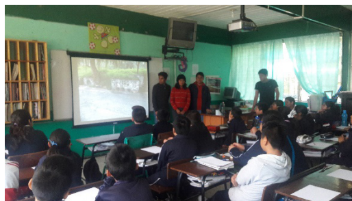
Figura 2: Trabajo de sensibilización y prevención con niños de primaria sobre la situación de riesgo de inundación en La Hacienda.