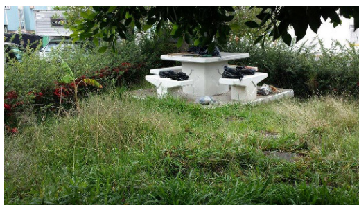
Figura 3: Estado de abandono del Parque de la 119.

En este caso observamos que las acciones para mejorar el espacio público atraen, incluso, a los habitantes más pasivos y que pueden incidir en la organización social para disminuir la delincuencia.