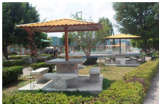
Figura 4: Parque de la 119, después de la intervención.

Con estas experiencias consideramos que hemos empezado a influir en la transformación de nuestro pensamiento, ya que el trabajo cercano con los actores implicados nos permite desarrollar empatías, idear propuestas y tomar decisiones conjuntas. Reconocemos que nuestro avance es lento y a veces desesperanzador, ya que prevalecen vicios añejos como el fuerte interés proselitista de las autoridades que, combinado con el paternalismo implantado socialmente, aletargan el cambio de paradigma. Sin embargo, visualizamos la transformación de la ciudad desde el cambio del pensamiento individual para transformar el colectivo. Detectamos que, trabajando desde la pequeña escala, a través de talleres, reuniones y la acción directa para mejorar los espacios públicos, es más factible transformar conciencias.