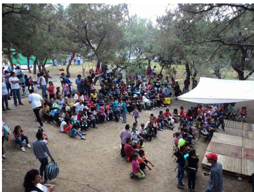
Figura 1: Parque del Esfuerzo. Celebración del día del niño.