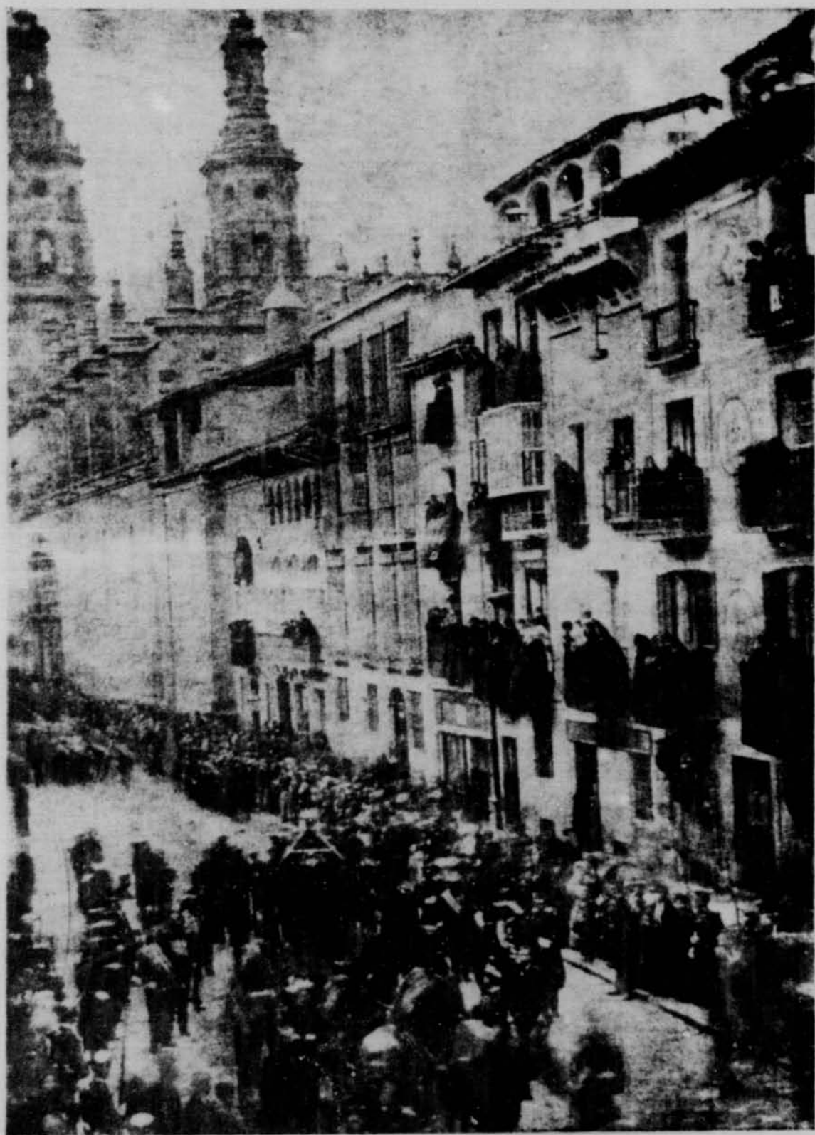
Paso de la comitiva fúnebre en el entierro del General Espartero por la calle del Mercado