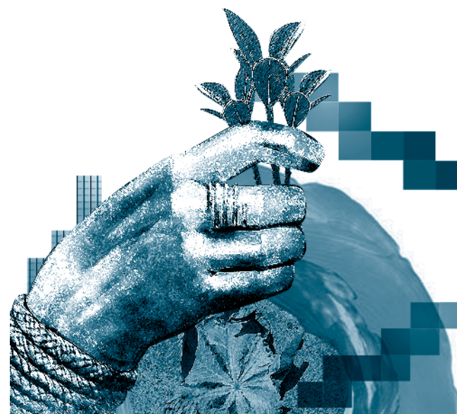
Figura 1. Bucle de la ciudadanía en contextos complejos e interdisciplinares de re-significación de tejidos sociales

Todo interés y participación responderá a las tendencias y emergencias de los sistemas y modelos de formación, pues los campos de acción y la confluencia de intereses marcan la pauta en las acciones de cambio, desde los elementos que constituyen la escuela, hasta las estructuras que soportan la sociedad (Proigogine, 1996). A continuación se expone la forma como se estructura un bucle, de naturaleza en espiral-virtuosa, entre el sujeto y la sociedad (Figura 1).