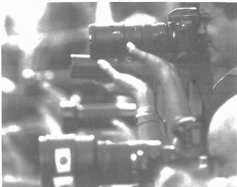
Fig. n.º 85.— Los fotógrafos de prensa en el callejón (Massats y Vidal, 1998: 115).

Paula, Espartaco, Ponce, Manolo Sánchez, Tomás, Conde..., nos muestran una sinfonía de expresiones con la muleta: derechazos, pases naturales y de pecho; otros matadores enseñan