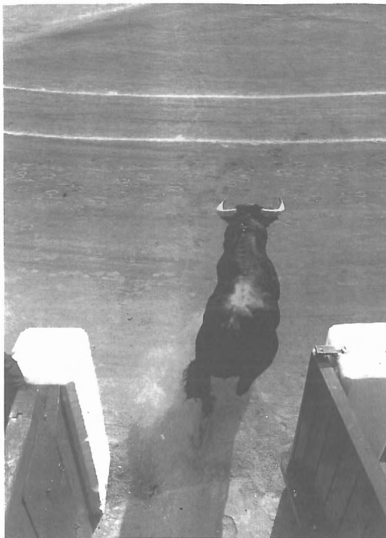
Fig. n.º 84.— Un toro salta a la arena de la plaza (Massats y Vidal, 1998: 96).