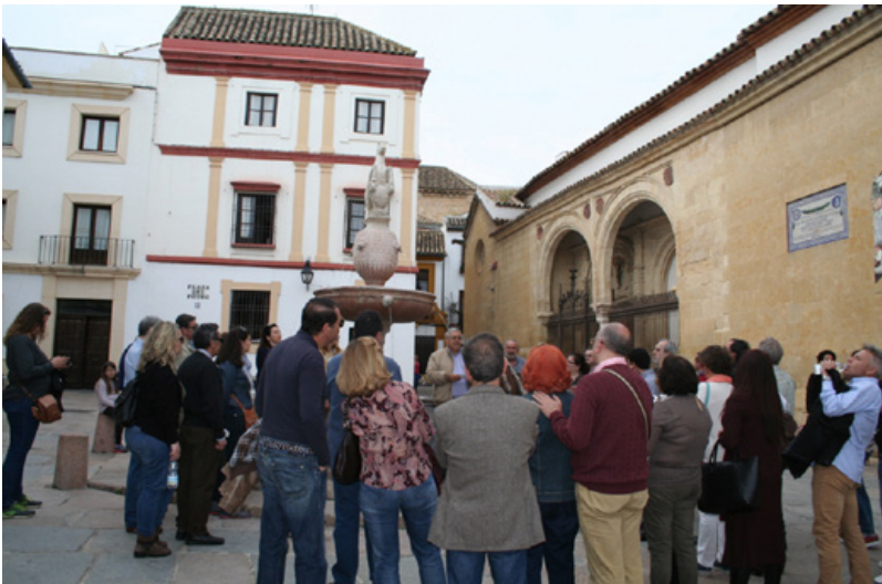
Figura 10. Ruta de Cervantes en Córdoba