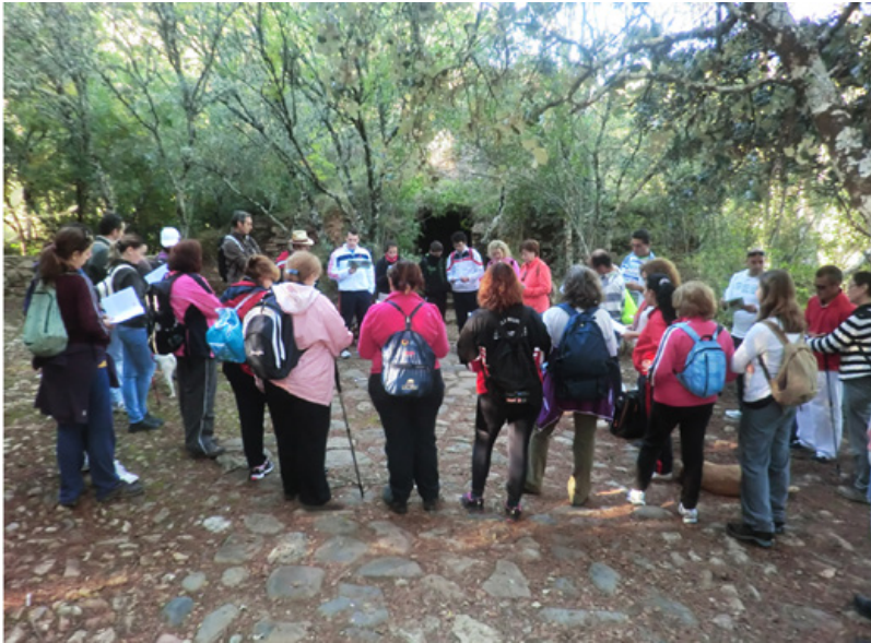
Figura 9. Senderismo literario