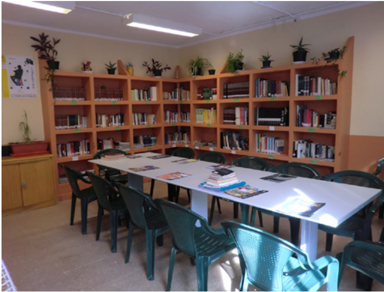
Figura 2. Sala de lectura del Módulo 4

Además, en algunos momentos, debido a la demanda, se han ampliado los clubes de lectura, en este caso gestionado por los propios internos, en los Módulos 8, 6 y 11. En esas salas se intentó crear un ambiente agradable, colorido y cercano al hábito lector y a la conversación.