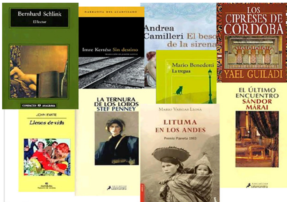
Figura 4. Portadas de algunos de los libros leídos