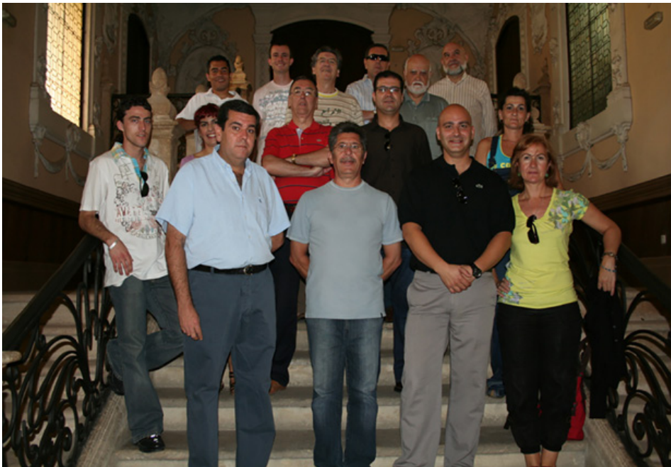
Figura 1: Visita de un grupo de internos a la Biblioteca Provincial de Córdoba

“Lecturas abiertas, puertas cerradas” comienza en 2007 con actuaciones puntuales y aisladas entre ambas instituciones. En principio, la colaboración se limitó a facilitar el acceso a la información a través de préstamos colectivos y a proporcionar ayuda al “Taller de literatura”, que empezó ese año en el Centro Penitenciario desarrollado por dos educadoras de prisiones. También, se concertaron visitas guiadas tanto de los internos a la Biblioteca Pública Provincial, como del personal de la biblioteca a la de la cárcel.