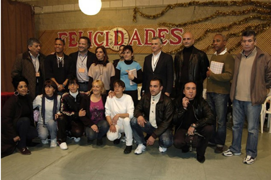
Figura 6. Día de la Lectura en Andalucía 2011