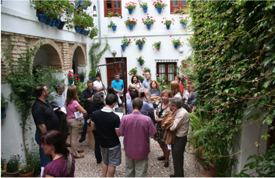
Figura 7. Poesía en los patios, 2011