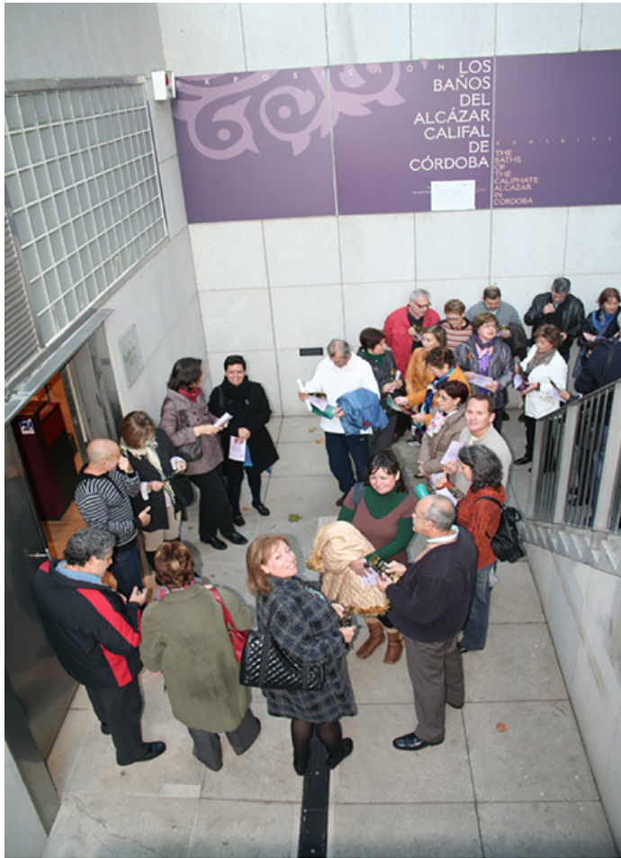
Figura 8. Visita a los Baños árabes de Córdoba