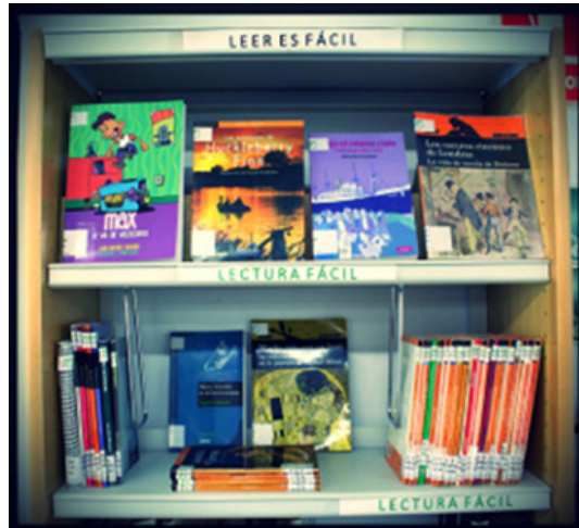
Figura 1. Sección dedicada a los libros de LF en la BPCO