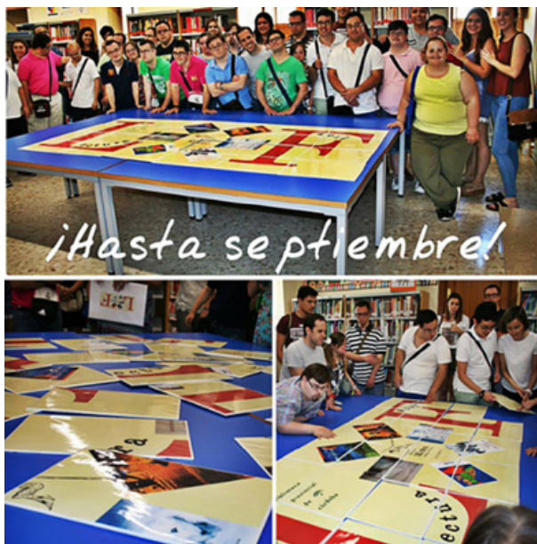
Figura 8. Puzzle mural sobre LF

gigante. Una vez terminado aparece el logo de Lectura fácil así como las portadas de las lecturas que han hecho a lo largo del curso. Resultó muy divertido componerlo entre todos y quedará decorando la sala infantil juvenil de la BPCO.