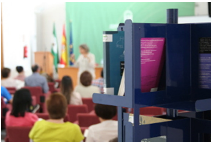
Figura 2. Encuentros Bibliotecarios Provinciales (Córdoba, 2014) sobre LF

Compromiso para crear CLF, y contacto con aquellos colectivos a los que pudieran resultar de interés. Se inicia la adquisición de lotes de libros de LF que se han ido incrementando cada año. En este momento, disponemos de 9 lotes con 15 ejemplares cada uno.