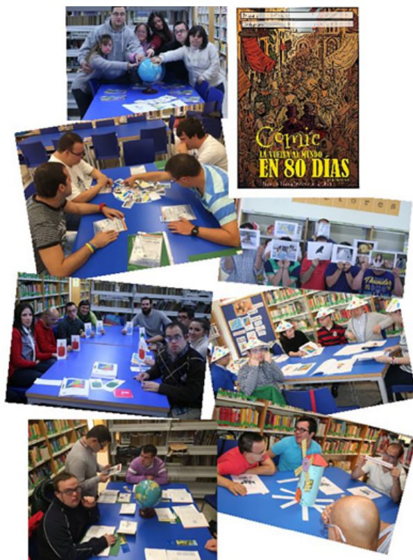
Figura 7. Distintas actividades de apoyo a la lectura en los CLF