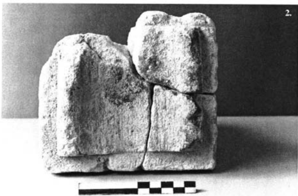
Lámina III: Altares de Uxama: