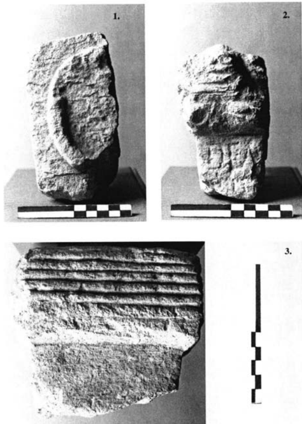
Lámina IV. Fragmento de altar dedicado posiblemente a Deganta en Uxama: