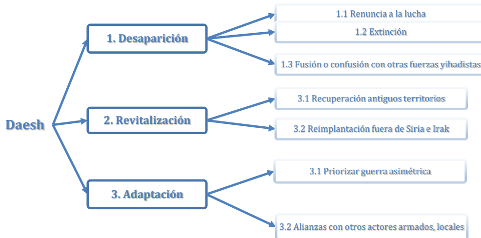
Figura 2: Posibilidades de evolución del Daesh, a partir de las tres opciones básicas

adopción de una estrategia basada en la priorización de formas asimétricas e irregulares de combate (guerra de guerrilla y terrorismo, principalmente), en detrimento de los modos convencionales orientados a la conquistar y el control de territorios o en el desarrollo de un pacto estable de colaboración con otras estructuras insurgentes o actores locales relevantes, que no implique renunciar a mantener su nombre o marca y que le permita seguir promoviendo su propio discurso y objetivos. Por último, Dáesh podría recuperar poder territorial mediante la reconquista de todos o algunos de los territorios previamente sometidos a su control en el escenario sirio-iraquí; o bien gracias a la reimplantación del califato en algún otro territorio, previsiblemente en alguno de los países donde operan alguna de las filiales del Dáesh.