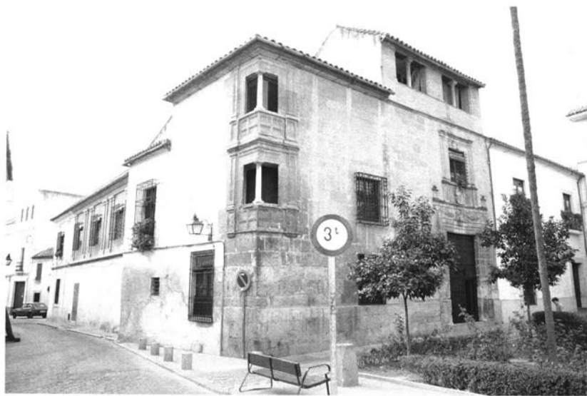
Figura 1. Casa atribuida a Hernán Ruiz I, que según tradición no confirmada perteneció a Fernán Pérez de Oliva.