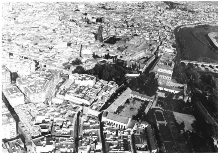
Figura 2. Vista aérea del centro humanístico del XVI, en la que se aprecia la masa de la Catedral, con el palacio episcopal delante, la Puerta del Puente a la derecha y, a continuación, el Seminario, el Alcázar Real y las Caballerizas Reales, en torno a la mancha verde del Campo Santo de los Mártires.