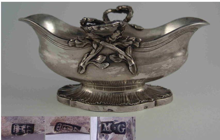
Fig. 10.- Salsera . Madrid. 1777. Miguel Guilla. Instituto Valencia de Don Juan de Madrid.

de ramas con hojas formando un lazo acorazonado, que se elevan sobre la boca y apoyan a media altura del cuerpo; y en uno de los extremos muestra escudo de hidalgo. Pie de tipo ovalado, pero de contornos formados por cuatro segmentos conopiales, con adorno de rocalla en la zona superior.