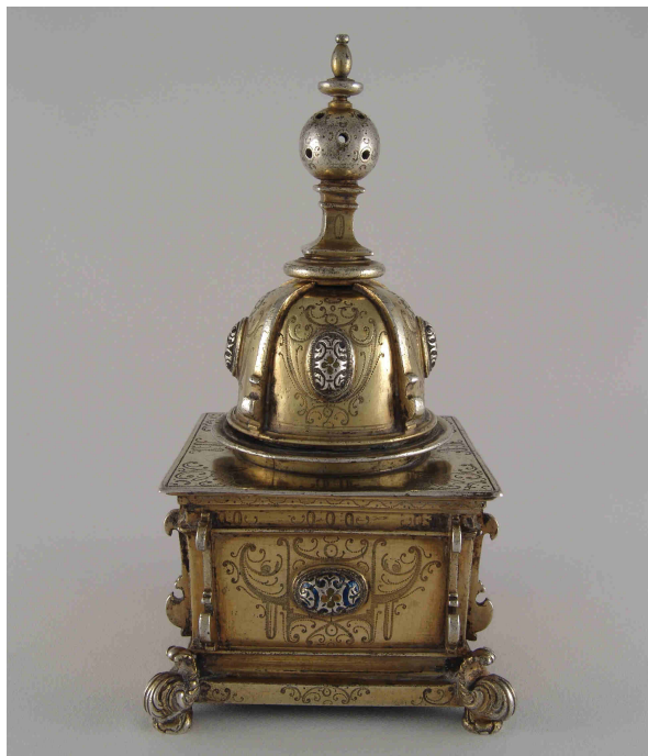
Fig. 2.- Especiero . Madrid. Hacia 1600. Instituto Valencia de Don Juan de Madrid.

Carente de marcas, pero también probablemente madrileño es el espléndido especiero (fig. 2) cúbico con tapador semiesférico rematado en pirámide con bola, de esmerado diseño y rica decoración de picado de lustre y espejos esmaltados, que cabe fechar hacia 1600. Es un modelo que apenas