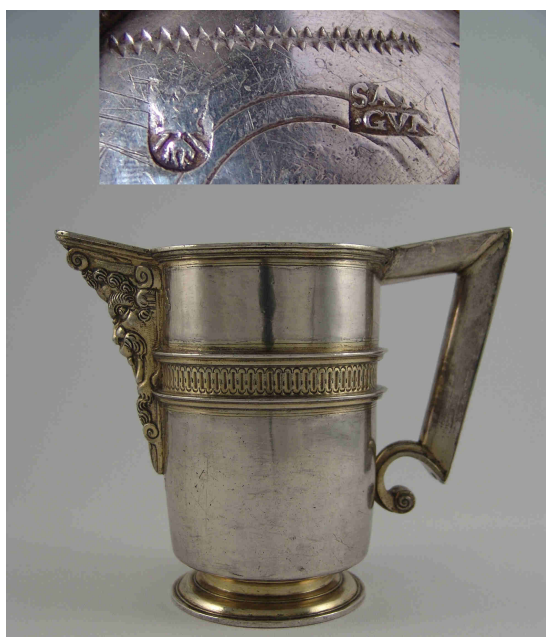
Fig. 1.- Jarro. Madrid. Hacia 1600. Instituto Valencia de Don Juan de Madrid.

Entre 1596 y 1617 está realizado el jarro de pico (fig. 1) del modelo vallisoletano, es decir, de cuerpo acampanado invertido con friso en la zona alta; asa de siete; pico adosado decorado con mascarón de rostro masculino