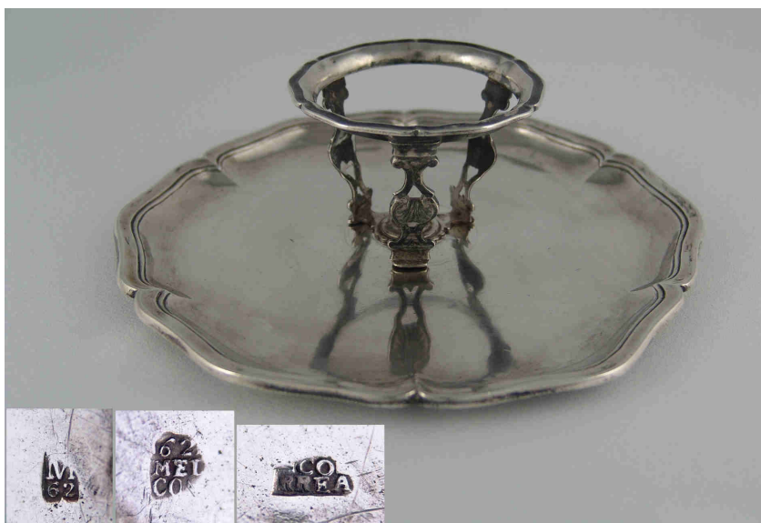
Fig. 8.- Mancerina . Madrid. 1762/1765. Blas Correa. Instituto Valencia de Don Juan de Madrid.

La siguiente pieza de la colección es otra mancerina (fig. 8), realizada en este caso por Blas Correa entre 1762 y 1765. Está formada por platillo de contornos con seis segmentos conopiales y borde moldurado; pocillo con