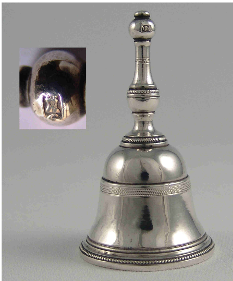
Fig. 13.- Campanilla . Madrid. 1806. Instituto Valencia de Don Juan de Madrid.

en el reparto equilibrado de la ornamentación en cenefas troqueladas de varios motivos decorativos, propios de la platería cortesana de los primeros años del siglo XIX.