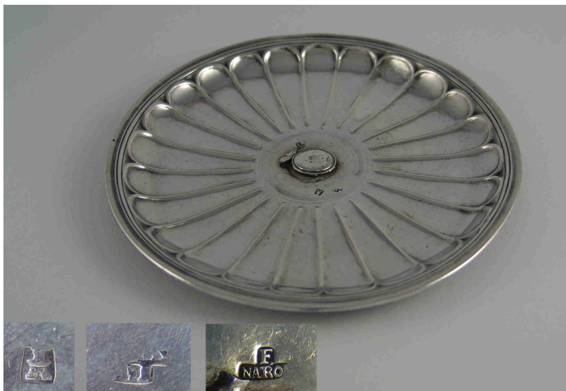
Fig. 6.- Mancerina . Madrid. 1747/1755. Francisco Narros. Instituto Valencia de Don Juan de Madrid.

de la Congregación. Debió de morir pronto, pues no se tienen más noticias suyas. Por ahora solamente se conoce esta pieza 8 .