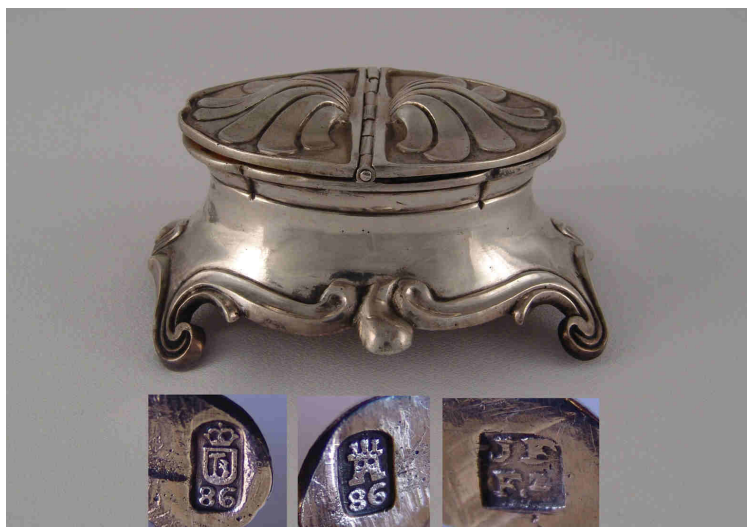
Fig. 11.- Salero. Madrid. 1786. José Antonio Fernández. Instituto Valencia de Don Juan de Madrid.

Tal y como reflejan sus marcas, en 1786 José Antonio Fernández realizó un salero (fig. 11) de planta ovalada, con cuerpo de perfil sinuoso que descansa sobre cuatro patas de tornapuntas; boca formada por cuatro segmentos, e interior dorado; y tapa doble con charnela en el centro que se dispone transversalmente y se adorna con ocho lengüetas radiales. Las letras MP del interior de una de las tapas deben de tratarse de una marca