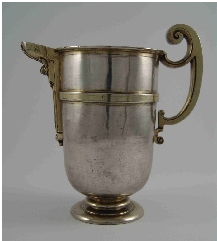
Fig. 4.- Jarro . Madrid. Medios del siglo XVII. Instituto Valencia de Don Juan de Madrid.