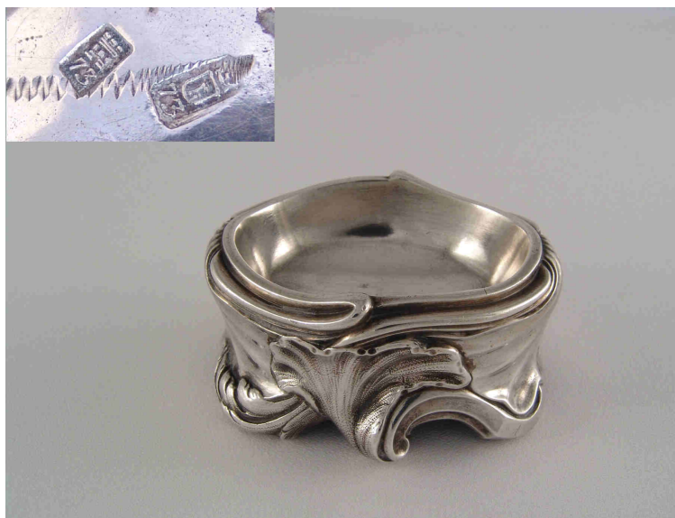
Fig. 9.- Salero . Madrid. 1773. Instituto Valencia de Don Juan de Madrid.