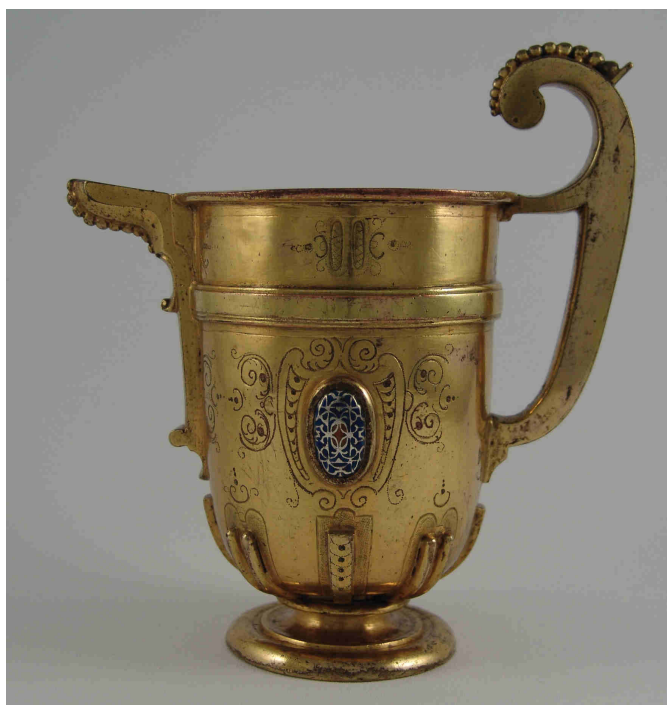
Fig. 3.- Jarro. Madrid. Primer tercio del siglo XVII. Instituto Valencia de Don Juan de Madrid.

De bronce dorado es otro jarro de pico (fig. 3), realizado quizás en Madrid durante el primer tercio del siglo XVII, pues sigue muy de cerca el modelo cortesano, que se caracteriza por el cuerpo cilíndrico terminado en