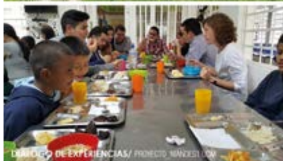
DIÁLOGO DE EXPERIENCIAS/ PROYECTO NIÑESKI UOM