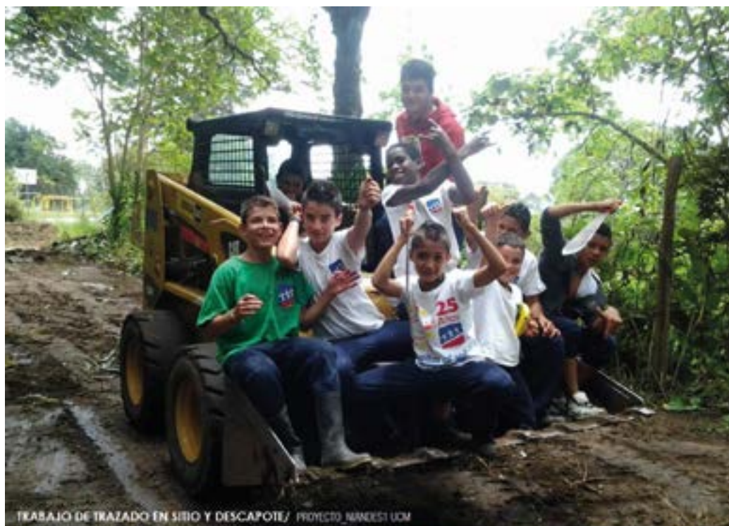
TRABAJO DE TRAZADO EN SITIO Y DESCAPOTE/ PROYECTO NIÑESKI UOM