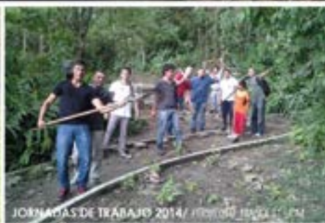
JORNADAS DE TRABAJO 2014/ PROYECTO NIÑESKI UOM