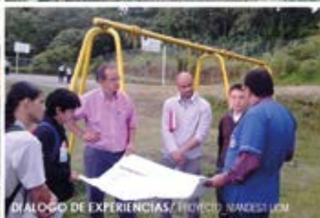
DIÁLOGO DE EXPERIENCIAS/ PROYECTO NIÑESKI UOM