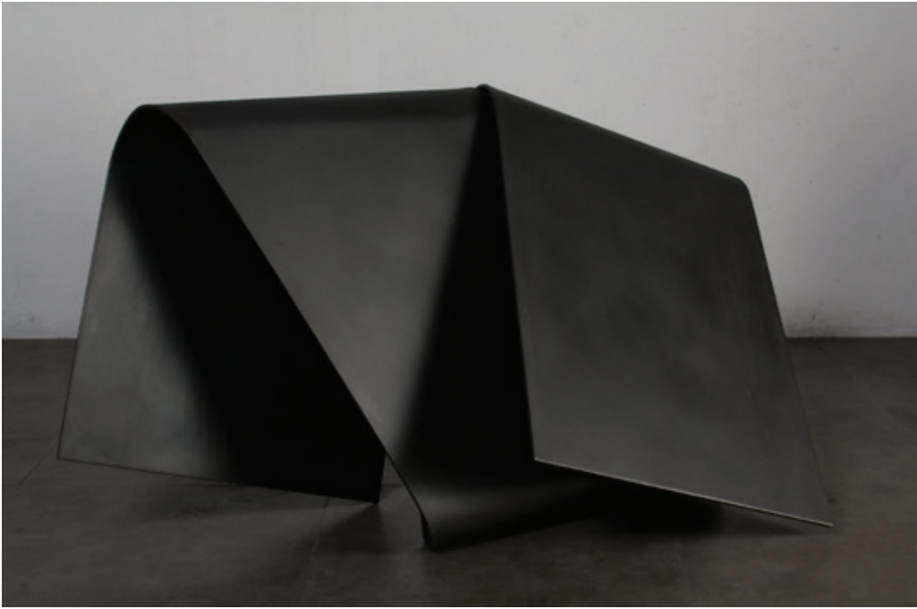
Envolvente horizontal 3 , (John Castles 2008), acero, 85 x 125 x 56 cm.