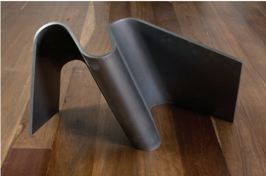
Triple diagonal , (John Castles 2008), acero, 38 x 60 x 48 cm.