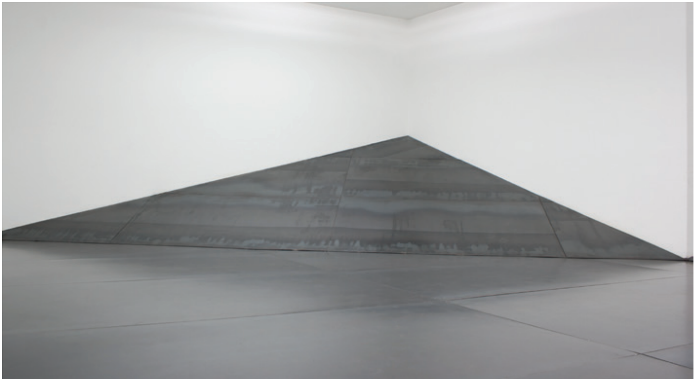
Mundo , (John Castles 2011), acero soldado, 36 m 2 , Galería Mundo.