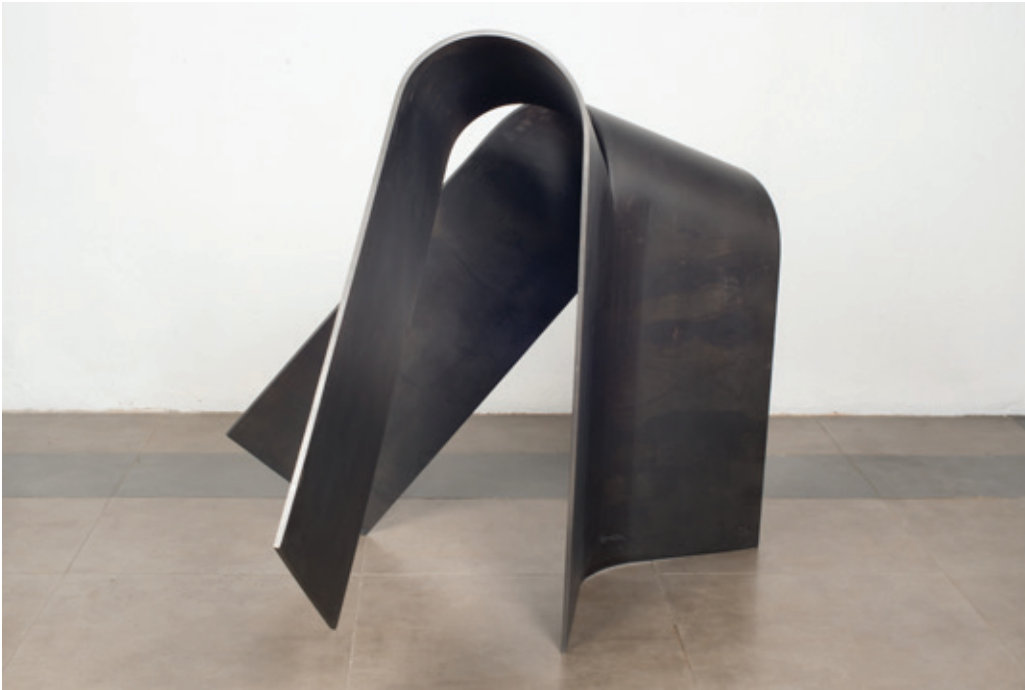
Abierto posterior , (John Castles 2014), acero cm.