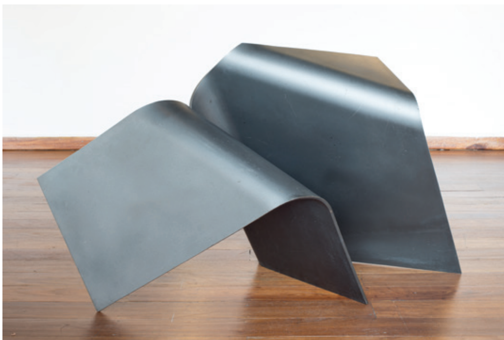
Perpendicular , (John Castles 2011), acero, 79 x 105 x 95 cm. Fotografía: Antonio Castles.