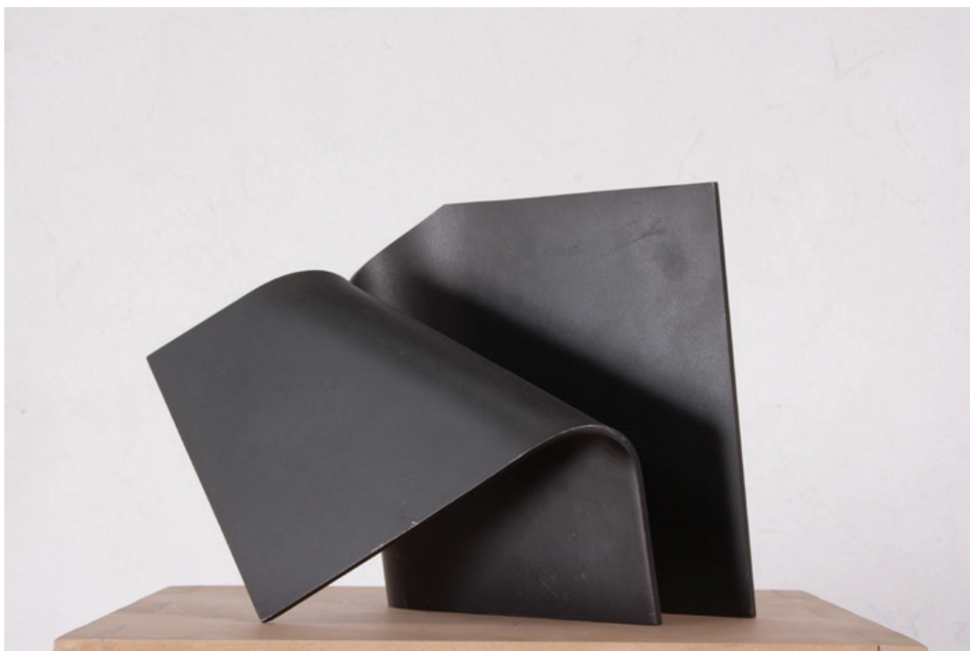
Perpendicular (John Castles 2010) acero, 16 x 23 x 32 cm.