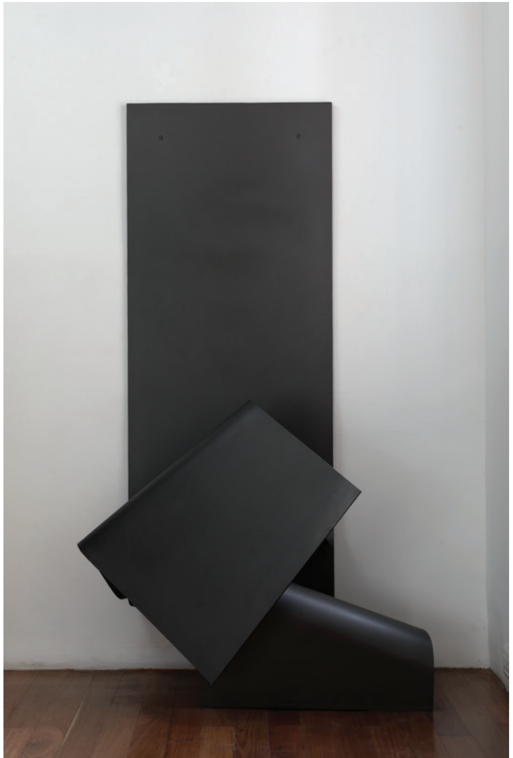
Cruzada , (John Castles 2017), acero soldado, 165,5 x 58 x 90 cm.