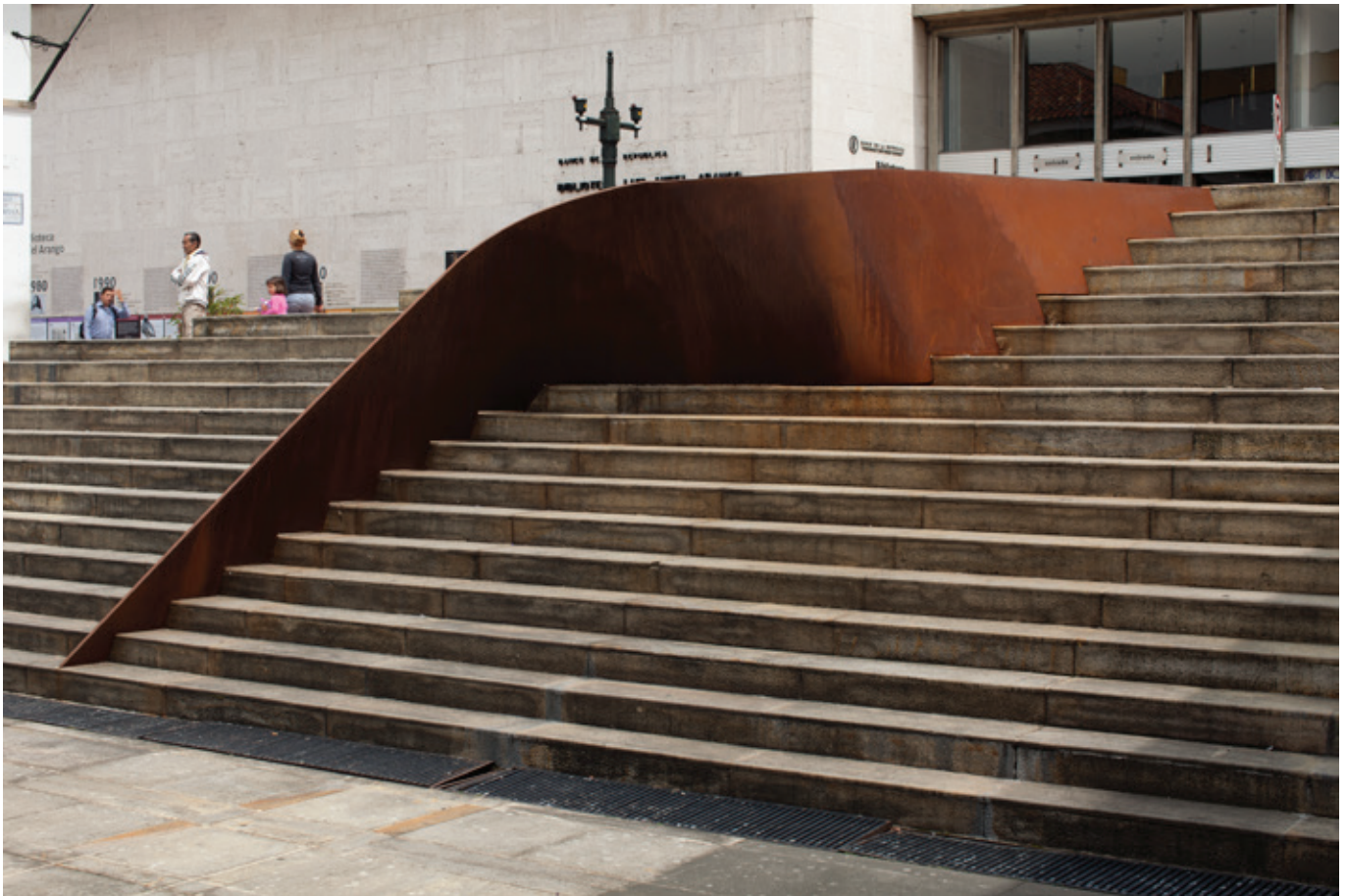
Escalonada , (John Castles 2016), acero, 297 x 515 x 472 cm, Museo de Arte Miguel Urrutia, MAMU.