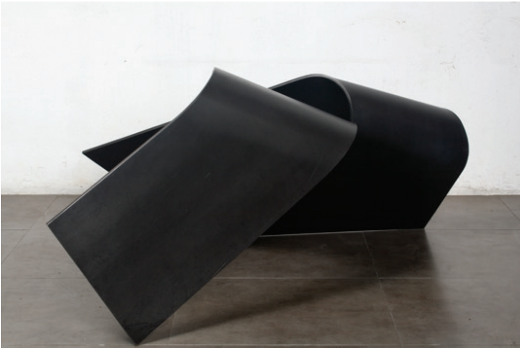
Rajada 2 , (John Castles 2009), acero, 70 x 142 x 126 cm.