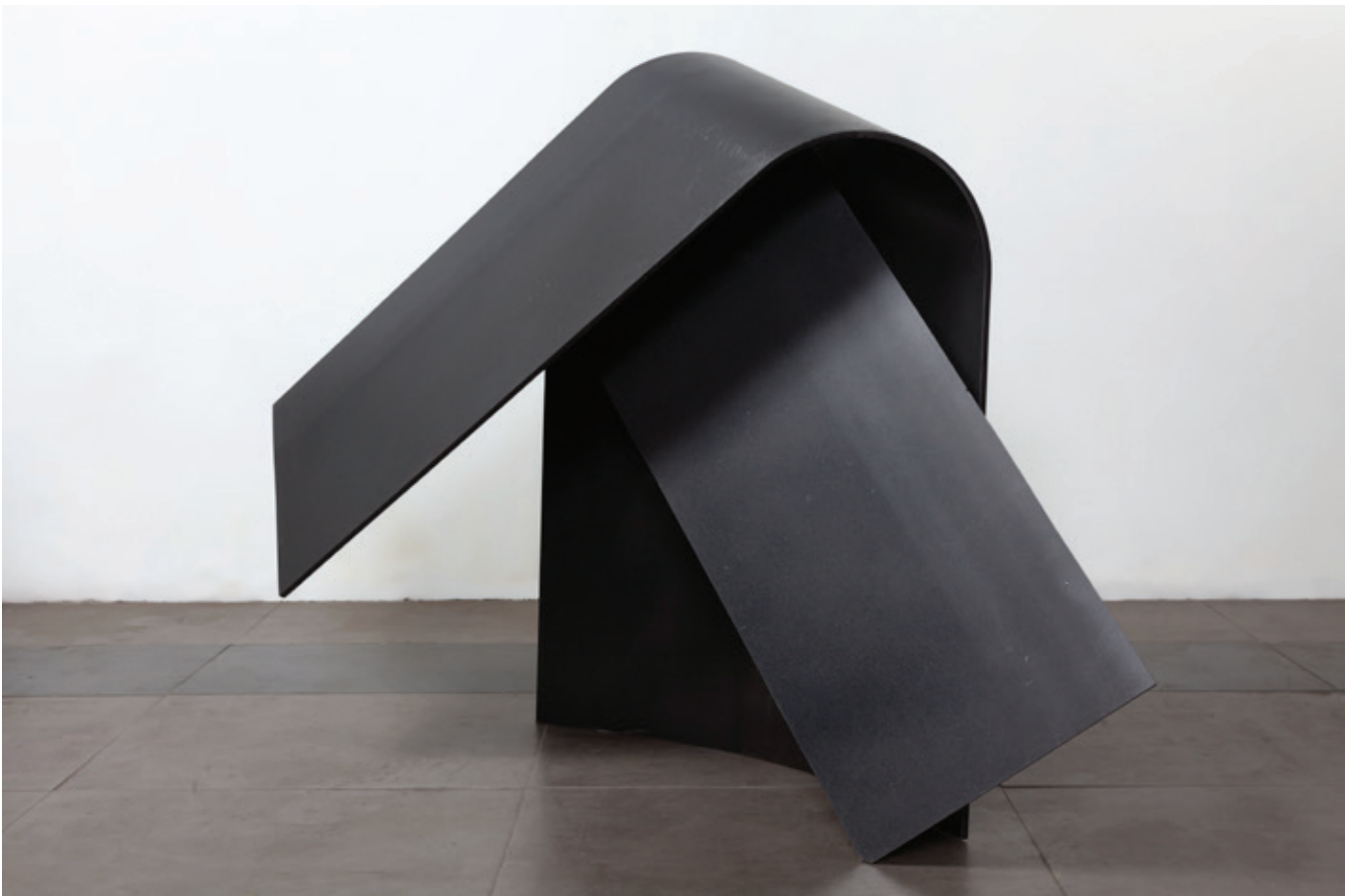
Cruzado frontal , (John Castles 2016), acero, 93 x 40 x 130 cm.

Bogotá. ArtNexus No.142, pg. 44-49, Marzo - Mayo 2015.