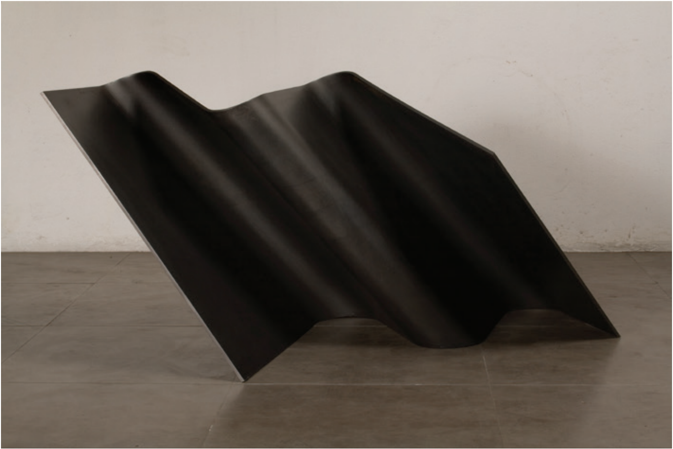
Triple 2 , (John Castles 2009), acero, 70 x 86 x 92 cm.