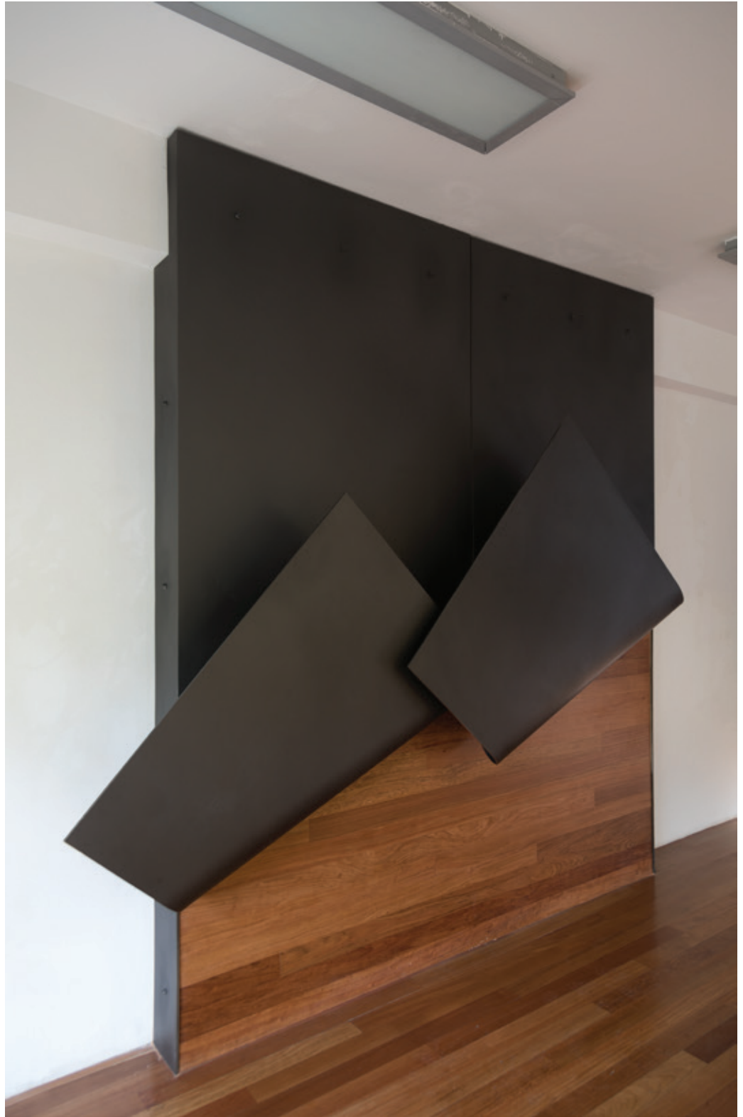
Ascendente , (John Castles 2017), acero y madera, 279 x 278 x 47 cm.