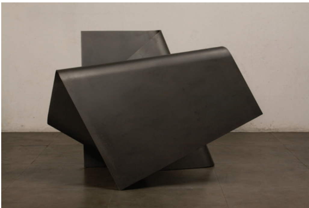
Horizontal , (John Castles 2008-09), acero, 89 x 75 x 120 cm.

Luis Fernando Valencia. “John Castles” Bogotá. Alonso Garcés Galería, Agosto, 2008.