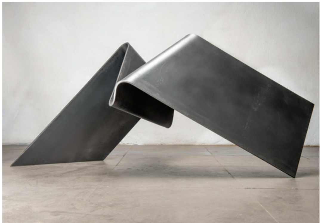
Paralelo , (John Castles 2014), acero, 67 x 98 x 135 cm.