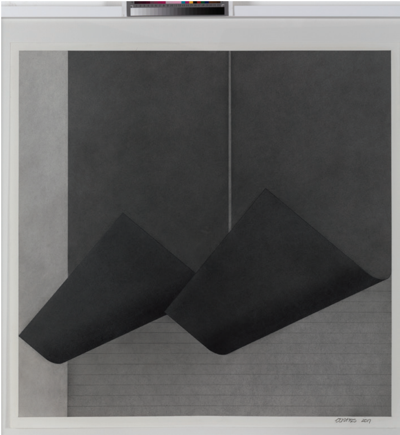
Ascendente , (John Castles 2017), grafito sobre papel, 70 x 70 cm.