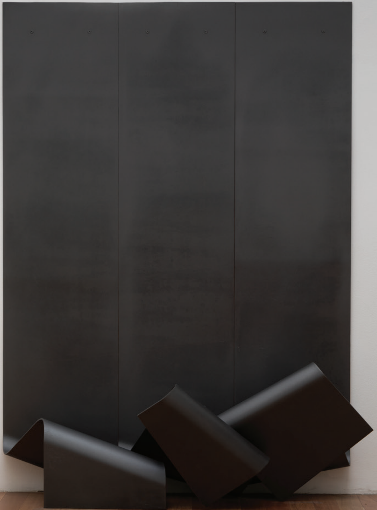
Ritmica , (John Castles 2017), acero, 169,5 x 126,5 x 45 cm.