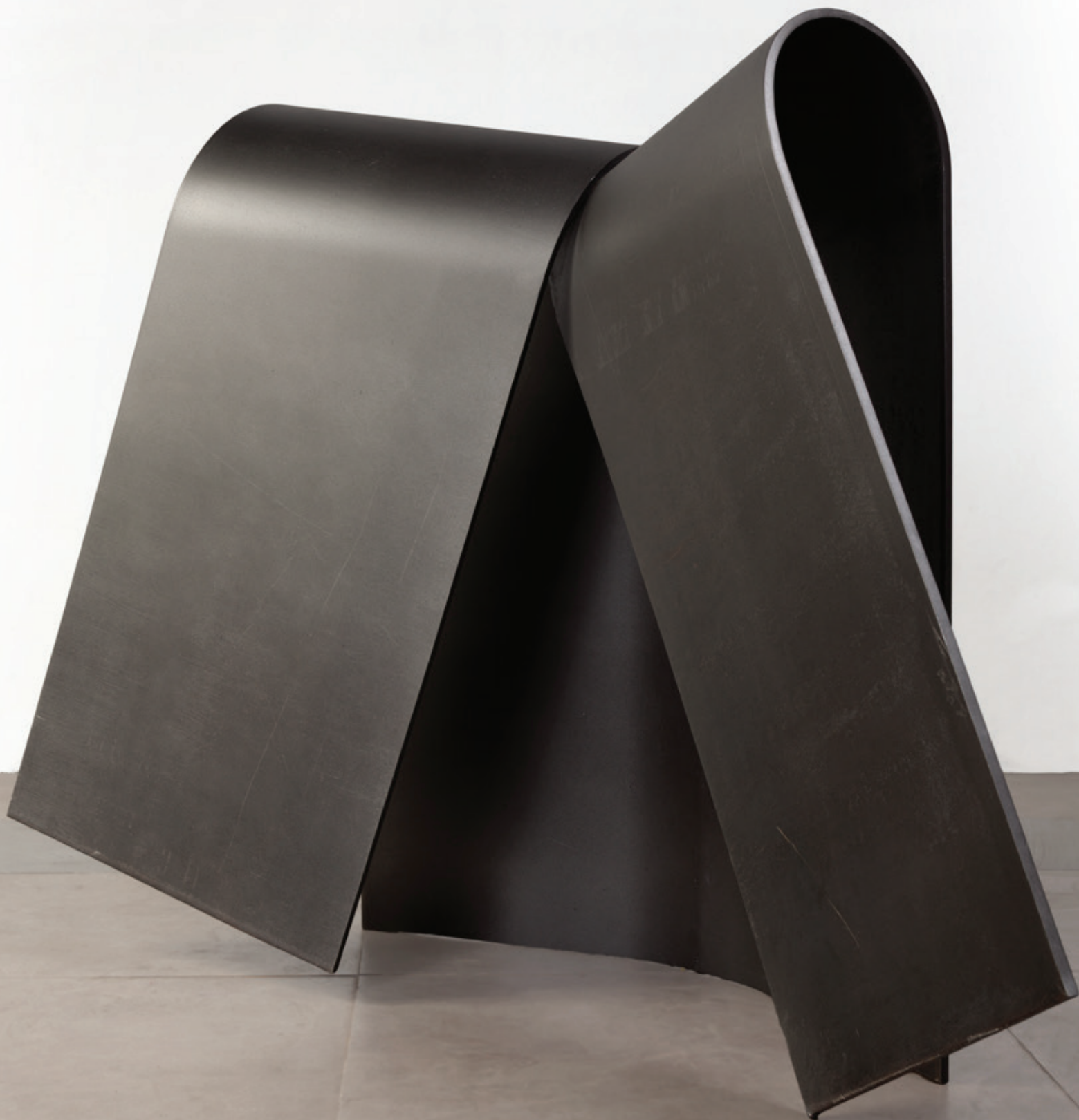
Abierto frontal , (John Castles 2015), acero, 88 x 115 x 70 cm.