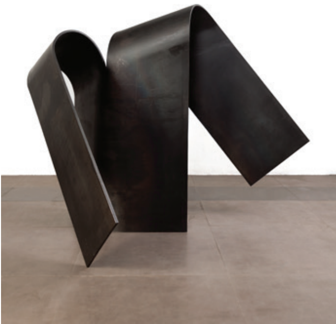
Diagonal alterno , (John Castles 2014), acero, 110 x 77 x 120 cm.