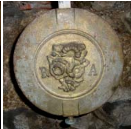
Lenteja del péndulo.

otra, la sonería de los cuartos, que se tocan en sendas campanas de la espadaña. En el hueco superior del campanario falta una campana más grande. El actual encargado de la iglesia, recuerda que hace bastantes años allí había una campana que se había roto, que la llevaron supuestamente para arreglar, pero que nunca volvió.