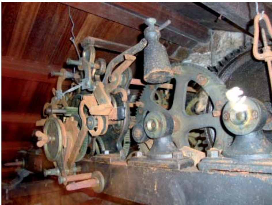
Vista general de la máquina.