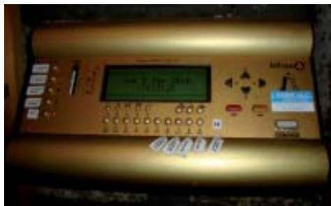
Consola electrónica de finales del s. XX.

que las pesas bajen a los lados, a izquierda y a derecha, del hueco de la puerta. Con el fin de evitar problemas, el recorrido vertical de las pesas se protegió por medio de unos largos cajones verticales que forman una especie de columnas huecas, construidas en madera barnizada.