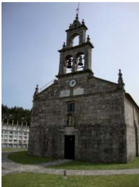
Fachada de la iglesia de Santa María de Verís (Irixoa).