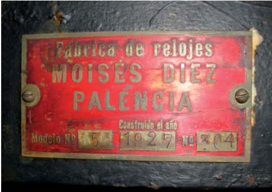
Placa de identificación.