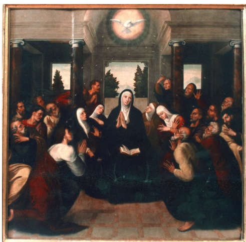
Fig. 2. La Pentecostés . Juan Correa de Vivar (atr.). Catedral de Santa María. Teruel.

La Pentecostés del Prado procedía del retablo mayor, o de uno menor dedicado a la vida de la Virgen y los Hechos de los apóstoles , del monasterio de los bernardos cistercienses de Santa María de San Martín de Valdeiglesias (fig. 3). En el siglo XVIII don Antonio Ponz lo fechó hacia 1550, durante el abadazgo del toledano fray Jerónimo Hurtado (ca. 1495-1558), 10 mientras que Isabel Mateo Gómez ha adelantado su hechura a la década anterior (ca. 1540-1545).