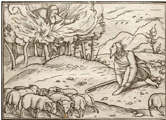
Fig. 5b. Detalle de fig. 5a.

Padre la admitida y representada, 31 como ocurre en esta ocasión y en la que Yahveh aparecería dos veces, de forma estrictamente icónica y de forma alegórica como símbolo analógico, y no como el tetragrámaton YHWH.