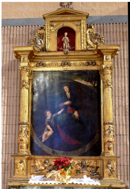
Fig. 8. Retablo del Colegio de Infantes de la iglesia parroquia de San Julián. Toledo.

tres versiones: una en la catedral (fig. 7); una segunda, más tardía, en el Colegio de Nuestra Señora de los Remedios o de Doncellas Nobles; y una tercera, actualmente en la parroquia de San Julián de Toledo, procedente del Colegio de Nuestra Señora de los Infantes, claramente de otra mano.