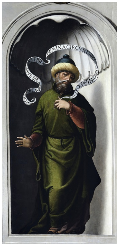
Fig. 6. El profeta Jeremías . Juan Correa de Vivar. Museo Nacional del Prado. Madrid Depositado en el Museo de Santa Cruz. Toledo.

novedad en la tierra, la mujer rodeará al hombre”); y Habacuc enseña un “EGRESSVS ES D[OMI]NE IN SALVTEM POPVLI TVI. ABACHVC C 3” (Hab 3, 13: “saliste para salvar a tu pueblo”). Naturalmente su significado era meridiano: la implicación de los judíos –fácilmente identificables como tales por su vestimenta, idéntica a la del Zacarías de la Visitación – en la visión profética del Nacimiento.