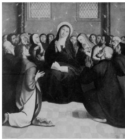
Fig. 3. La Pentecostés . Juan Correa de Vivar. Museo Nacional del Prado. Madrid.

Sin embargo, la aparente dependencia de la Resurrección de Teruel respecto a una estampa del mismo tema grabada por Cornelis Cort en 1569 sobre una composición del dalmata Giorgio Giulio Clovio, con un dinamismo corporal exacerbado que se aleja del puesto de manifiesto en su propia versión de la villa de Griñón, 11 plantearía unos problemas de autoría que habrán de