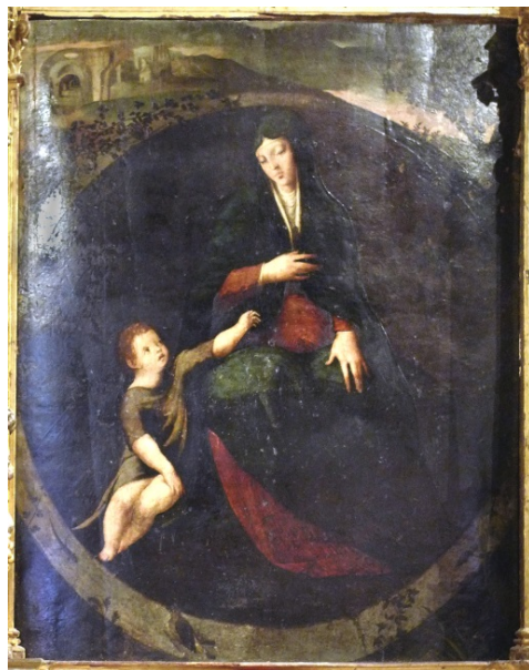
Fig. 9. La Virgen del pozo . Luis de Velasco (atr.). Detalle de fig. 8.

Las de los colegios, sendas fundaciones cardenalcias, tuvieron que salir del ambiente arzobispal y la más antigua de ellas (la de los Infantes) parece, más bien, a tenor de la documentación conservada, obra de Luis de Velasco ( ca.