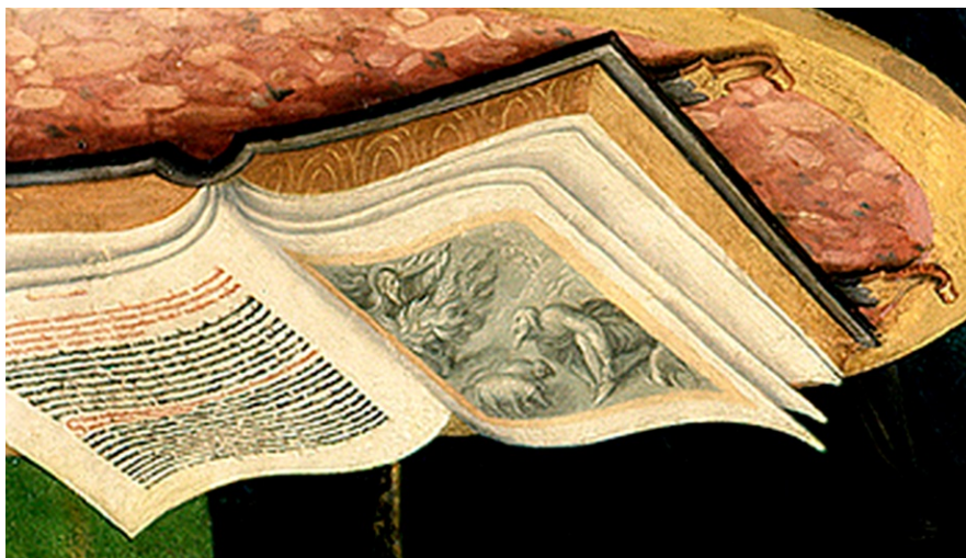
Fig. 4. Moisés ante la zarza ardiendo . Detalle invertido de fig. 1.

Otro elemento que habría que tener en cuenta en este contexto sería lógicamente la aparición –aun en una posición invertida que dificultaría su percepción a cualquier espectador antiguo o actual, pero no a la propia Virgen– del libro con una estampa de Moisés ante Dios Padre sobre la zarza ardiente (Ex 3, 1-3). Este detalle constituye un punto nodal de la Anunciación de Correa en el Museo del Prado y constituye el fragmento con el que iniciábamos este artículo (fig. 4). 21