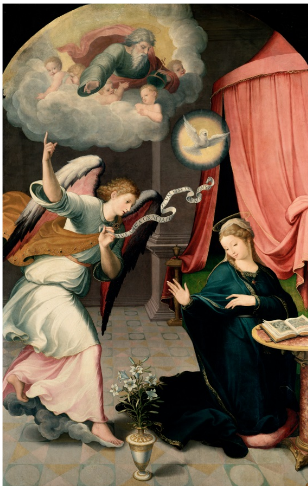
Fig. 1. La Anunciación . Juan Correa de Vivar. Museo Nacional del Prado. Madrid. Procedencia: Monasterio de San Jerónimo. Guisando (Ávila).

plantear algún problema interpretativo, ser resueltos en su significado. Uno de ellos es la imagen invertida representada como dibujo o grabado en un libro de horas ante el que reza la Virgen María en la pintura de la Encarnación o Anunciación (óleo sobre tabla, 225 x 146 cm, P02828), datada en 1559 (fig. 1) y procedente del monasterio de San Jerónimo de Guisando (Ávila). Lo que aparece figurado, en cierto sentido “cripto-representado” o parcialmente escondido, es una imagen de Moisés ante Dios Padre sobre la zarza ardiente , cuya significación en términos de metáfora de la virginidad de María en la concepción y parto de Jesús es bien conocida.