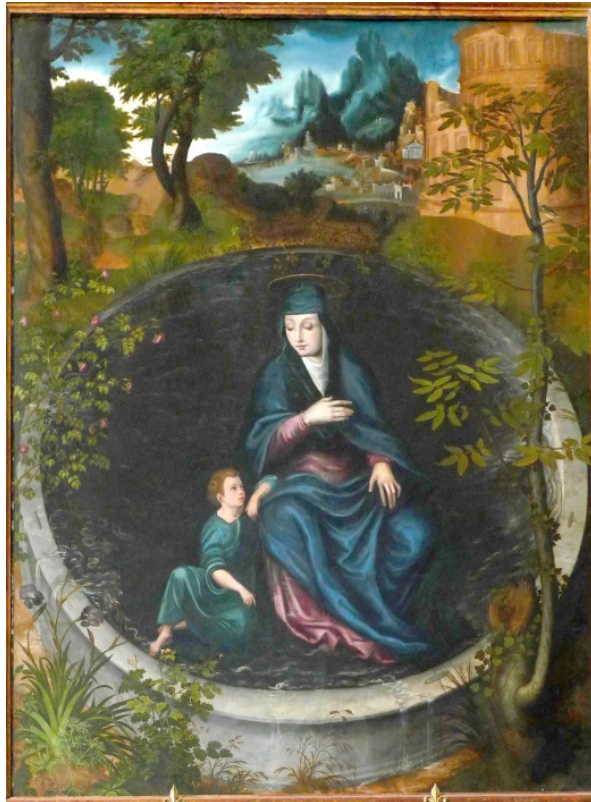
Fig. 7. La Virgen del pozo . Francisco de Comontes (atr.). Capilla de San Pedro. Catedral. Toledo.

estofado se pagó a Correa, tasando su labor Comontes y Manuel Álvarez. 46 Incluso en 1561, cuando el cabildo le encargó junto a Alonso de Covarrubias un retablo para la Capilla del Crucifijo, el contrato se suspendió al reclamar Comontes como maestro de pintura de la catedral.