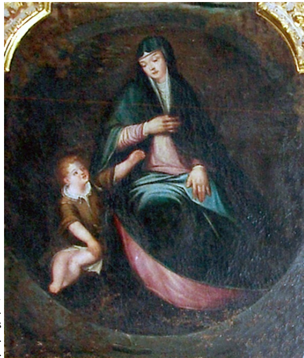
Fig. 10. La Virgen del pozo . Copia sobre Luis de Velasco. Colegio de Nuestra Señora de los Remedios o de Doncellas Nobles. Toledo.

1530-1606), de 1556-1557, tasada este último año por Correa y Alonso de Comontes (aunque tal vez Francisco) en su pintura y por Alonso de Covarrubias y Nicolás de Vergara el Viejo en su mazonería (fig. 8). 48 Es posible que esta pintura, sin embargo, fuera la de la mazonería y que esta tabla (fig. 9) se nos quede todavía en busca de autor. La versión de la catedral, 49 no conocida hasta prácticamente 2010 y hoy en la capilla de San Pedro, 50 ha sido atribuida a Correa, de forma más bien mecánica, al darse a conocer, como lo había sido la tabla de los Infantes por razones también puramente estilísticas.