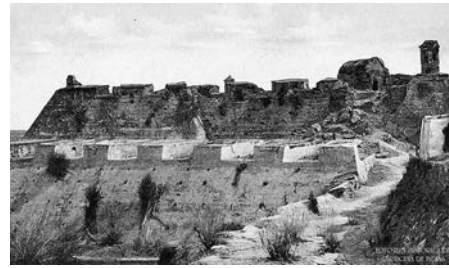
Foto 22. Castillo de San Felipe

En 1959, con la Ley 163, por la cual se dictan las medidas sobre defensa y conservación del Patrimonio Histórico, Artístico y de Monumentos Públicos de la Nación para la Protección del Patrimonio, se inicia el proceso de reconocimiento y declaratoria de Monumentos Nacionales, hoy bienes de interés cultural (BIC) del ámbito nacional, que se aplica a los centros históricos.