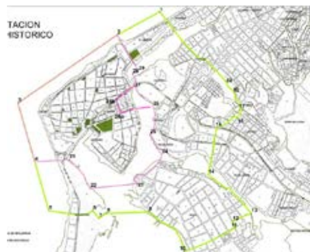
Foto 24. Delimitación de Periferia Histórica y área de influencia – PEMP 2010.