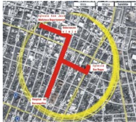
Foto 6. Centro Histórico de Barranquilla, 2005. (Barranquilla, 2012)

En la ciudad de Barranquilla se generó la preocupación por el poco patrimonio que se mantuvo en pie, frente a la avalancha de comercio que inundó su centro. Estos mismos comerciantes apoyaron la iniciativa para su recuperación.