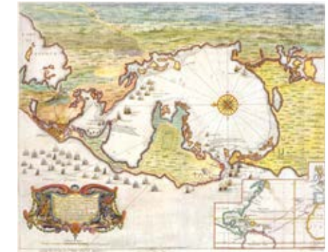
Foto 8. Plano de la Bahía de Cartagena de 1741, donde se aprecia la resguardada bahía interior, factor determinante para la consolidación de la ciudad

pidamente en un enclave estratégico de primera importancia en el Caribe.