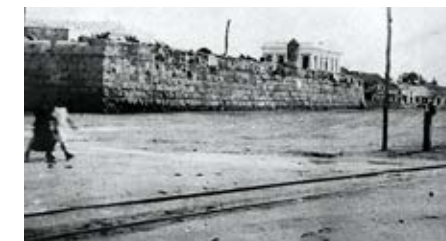
Foto 19. Baluarte de San Pedro Apóstol demolido entre 1916 a 1924.