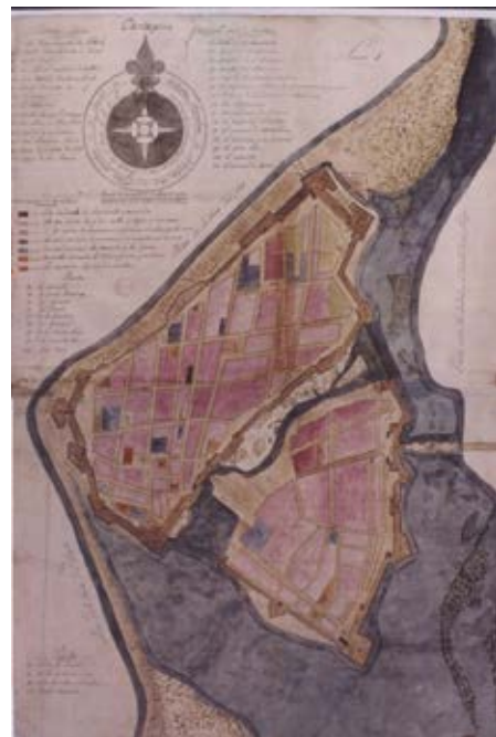
Foto 10. Plano Geométrico de la Ciudad de Cartagena de 1823. Este plano fue realizado durante en los inicios de la vida republicana de la nación

mercial y cultural que hizo florecer la sociedad cartagenera. El valor geopolítico de la ciudad se consolida y es objeto de varias invasiones, ataques y saqueos que sirven de precedente para realizar acciones que garanticen su seguridad. Se fomenta la construcción de edificaciones en piedra y se emprende entonces una titánica estrategia militar de fortificación de la ciudad y su bahía interior, dando inicio a la consolidación de un conjunto amurallado compuesto por: baterías, cortinas de murallas, baluartes y fuertes dispuestos para su defensa y protección.