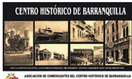
Foto 7. Imagen de promoción para la recuperación del Centro Histórico de Barranquilla. (Barranquilla, 2012)

En la ciudad de Barranquilla se generó la preocupación por el poco patrimonio que se mantuvo en pie, frente a la avalancha de comercio que inundó su centro. Estos mismos comerciantes apoyaron la iniciativa para su recuperación.