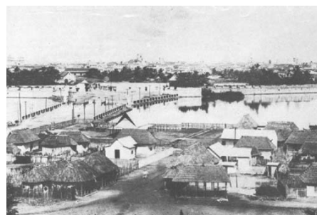
Foto 15. Revellín de la Media Luna, demolida en 1884. Puerta de acceso a la ciudad desde tierra firme. (Archivo Fototeca Histórica de Cartagena).