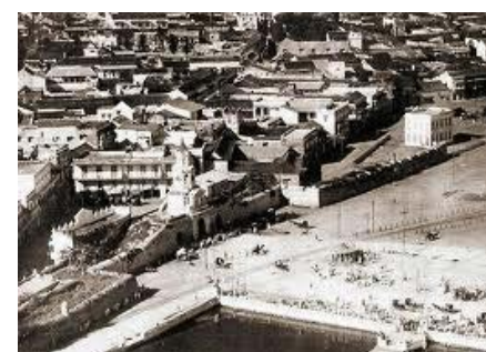
Foto 17. Vista aérea con Baluarte de San Pedro Apóstol, se aprecia ya la demolición del resto de cortina y el Baluarte de San Pablo.