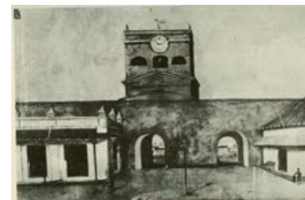
Foto 16. Ilustración de la Torre del Reloj, con solo dos de sus puertas. En 1905 se abrió la tercera puerta.