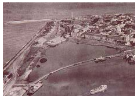
Foto 14. (Scadta, 1928). Carrilera del tren que llegaba al muelle de la Machina. Sin construir se encontraba el parque de la marina, donde primero se asentó el barrio Pueblo Nuevo.

el caso de la demoliciones del sector entre la boca del Puente y la India Catalina, y los baluartes que habían en ese trayecto: San Pedro, San Andrés y San Pablo que terminó con el relleno del sector, dando paso a las vías del tren. En el orden urbano, respondió a necesidades de conexión vehicular entre las nuevas vías de la ciudad y el sector amurallado, provocando pérdida de sectores de muralla.