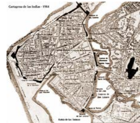
Foto 12. Plano del Centro Amurallado y Chambacú, 1964. Este plano registra el barrio de Chambacú, que fue erradicado en 1971, con miras a establecer condiciones urbanas que propiciaran el desarrollo del turismo, de acuerdo con los intereses inversionistas y del gobierno

de expansión. Se originaron cambios como el relleno del caño de San Anastasio para dar espacio a las vías del ferrocarril que más tarde dio paso a la urbanización La Matuna y se derribaron tramos de muralla interconectando la ciudad con el centro amurallado que se consolidó como su centro administrativo, económico, social, político y cultural.