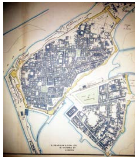
Foto 11. Plano de Cartagena de Indias (S. Pearson & Son LTD, 1925). En este plano se registran las vías del tren, pero también los barrios extramuros de la ciudad

varon a este florecimiento de la ciudad también sirvieron de contexto a la entrada de la gesta revolucionaria independentista que acabó con la dominación española. Ya sin los españoles al mando y con la inestabilidad generada después de la independencia, la ciudad y sus fortalezas se sumieron en el descuido y el abandono. Esto favoreció la conservación de la ciudad amurallada, pero una vez llegó el repunte económico a finales del Siglo XIX y de principios del Siglo XX, se originaron grandes cambios en su conformación, para dar paso a sus necesidades de expansión.