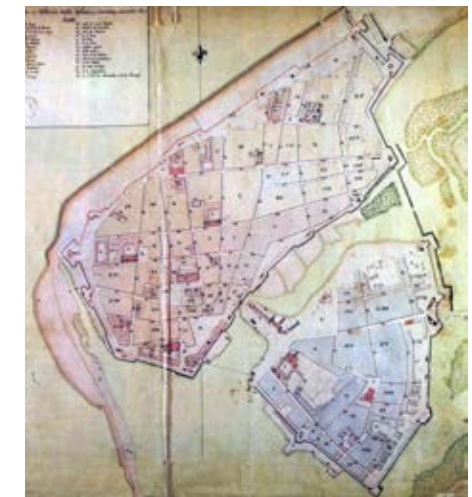
Foto 9. Plano de la Plaza y Arrabal (Anguiano, 1804), donde se evidencia la consolidación del recinto amurallado antes de la gesta de independencia.

La condición de puerto de abrigo y tránsito obligado hacia las fundaciones y virreinos de la Nueva Granada, desde España y todo el Caribe, da lugar a un continuo intercambio co-