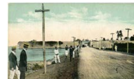
Foto 20. Puente de Manga donde se registra la apertura del boquete en la muralla de Getsemaní, llamada Puerta del Reducto para dar paso al Puente Román (1905).

Para ese entonces también habían ocurrido serios daños en la estructura del Fuerte de San Felipe de Barajas, por efecto de la vegetación parásita que lo invadía y la continua sustracción de materiales para la construcción de nuevas viviendas y edificaciones aledañas.