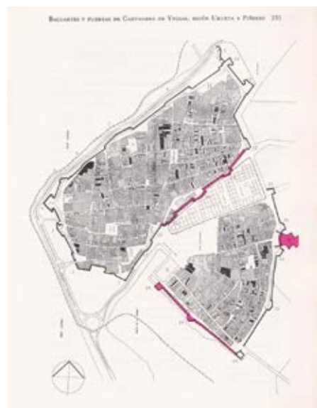
Foto 13. Plano del centro Histórico de Cartagena de Indias (Cabellos Barreiro, 1991) que muestra las secciones de cortinas de murallas y baluartes perdidas durante “el muralicidio”.