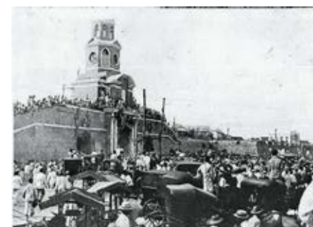
Foto 18. Baluarte de Torre del Reloj y baluarte de San Pedro Apóstol al fondo. La población la utilizaba como escenario para los espectáculos públicos.