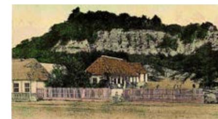
Foto 21. Castillo de San Felipe de Barajas a principios del siglo XX, usado como cantera. (Archivo Fototeca Histórica de Cartagena).

Para ese entonces también habían ocurrido serios daños en la estructura del Fuerte de San Felipe de Barajas, por efecto de la vegetación parásita que lo invadía y la continua sustracción de materiales para la construcción de nuevas viviendas y edificaciones aledañas.