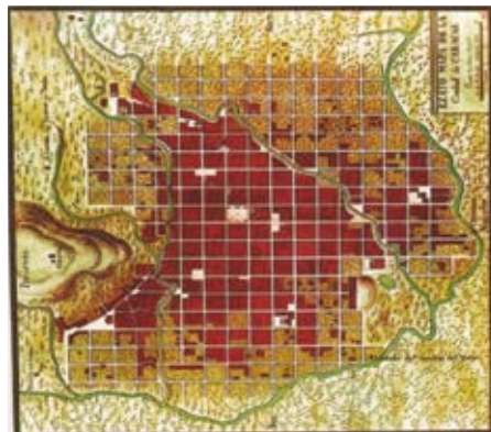
Foto 5. Caracas 1775.