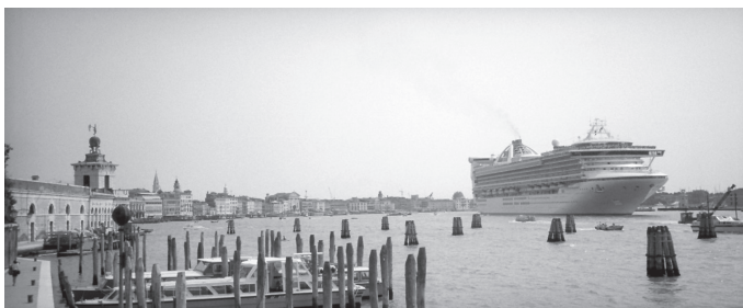
Figura 2. Llegada del crucero Princes a Venecia. Autor: Joe Shlabotnik. Fuente: Flickr

Ese centro, que había sido conquistado por la burguesía, con el tiempo sufrió nuevas transformaciones y perdió su carácter residencial, en favor de su carácter simbólico y comercial, que derivó en una teatralidad exacerbada. En la actualidad, las ciudades han adquirido la lógica de las cadenas de montaje y establecido mecanismos que inducen a transitar por itinerarios programados. El recorrido de los grupos de turistas en las ciudades, cada vez más tematizadas, resulta elocuente. El turista , en contraposición con el viajero , ansioso de lo que Moles y Rohmer denominan una aculturación sin riesgos , es despojado de su individualidad y se convierte en un producto que es inducido por vías y establecimientos, y que recorre una cadena precisa y programada para el espectáculo y el consumo. ¿Hasta qué punto una ciudad puede acoger estos tránsitos sin llegar al colapso? ¿Cuál es el límite? En ese sentido, las ciudades empiezan a calcular su capacidad máxima para establecer su capacidad de explotación. ¿Cuántos cruceros puede soportar una ciudad como Venecia (fig. 2)? 23 ¿Asistiremos a la copia de ciudades?