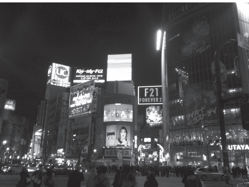
Figura 3. Burger City.

En esa misma dirección, los centros comerciales, ahora catalizadores de la vida social, han creado simulaciones de espacios públicos en los que el control resulta más severo y también más refinado. Se escenifica la gestión del miedo con la aparición de dispositivos de control biopolítico que presuntamente facilitarían la seguridad personal: accesos infranqueables, edificios blindados extremadamente vigilados, urbanizaciones hiperprotegidas, gated communities , etc., que forman un universo hipnotizado, una ciudad contemporánea configurada bajo las fórmulas del control y diseñados para "interceptar, repeler o filtrar posibles intrusos". 29 Y es este el mismo escenario de un urbanismo distópico obsesionado con la seguridad el que ya identificó Mike Davis como una endémica ecología del miedo , 30 o Michael Foucault, en sus ciudades carcelarias , cuanto detectó el atrincheramiento, voluntario e involuntario, de los ciudadanos en islas urbanas visibles y no tan visibles. 31 Detrás de todos estos mecanismos de autoprotección subyace una microfísica del poder, una defensa del lujo, del estatus, de la posición social que generalmente tiene sus mayores consecuencias en el control del espacio público y en la proliferación de espacios seudopúblicos. Y, en este sentido, nos estamos refiriendo tanto al espacio urbano como al social, bien por su eliminación, bien por su deshumanización.