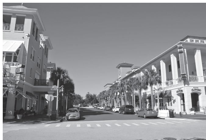
Figura 4. Celebration, Florida.

El fracaso de las utopías presentaba con anterioridad otros ejemplos notorios, muchos de ellos relacionados con la decadencia de las megaestructuras. La demolición, en 1972, de Pruitt-Igoe (St. Louis, Missouri), complejo residencial construido por Minoru Yamasaki, en 1954-1955, bajo las premisas de la ortodoxia moderna, fue subrayada por Charles Jencks como el punto clave para la defunción del racionalismo. Se escenificaba así el fracaso de la planificación racionalista que, en este caso, había derivado en un estilo de vida degradado y conflictivo, y que se declaró zona de desastre social. En un mismo contexto, Thamesmead, una de las primeras new towns planteadas para aliviar la presión residencial de Londres