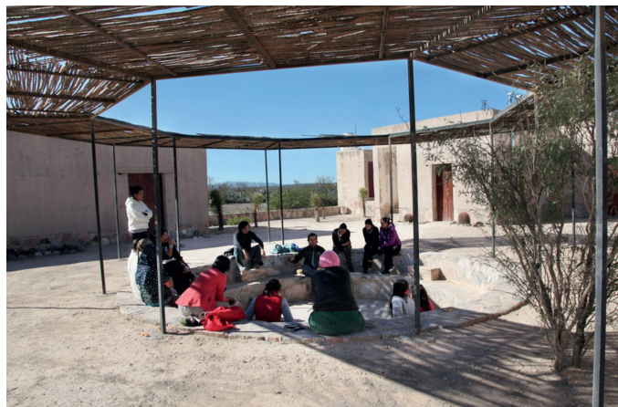
Lugares de juego, encuentro e intercambio social.