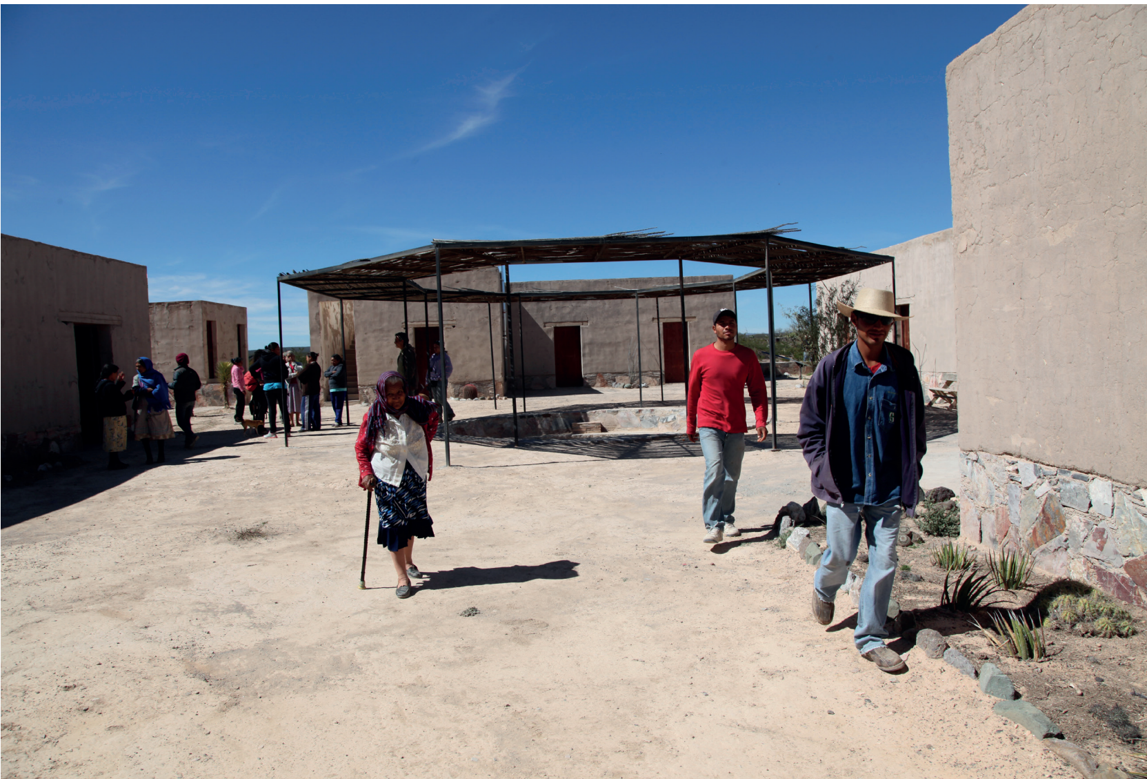
Espacio central de reunión.