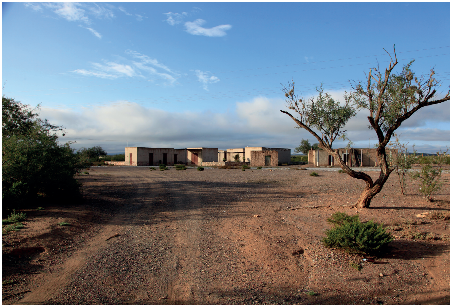
Vista general del proyecto.