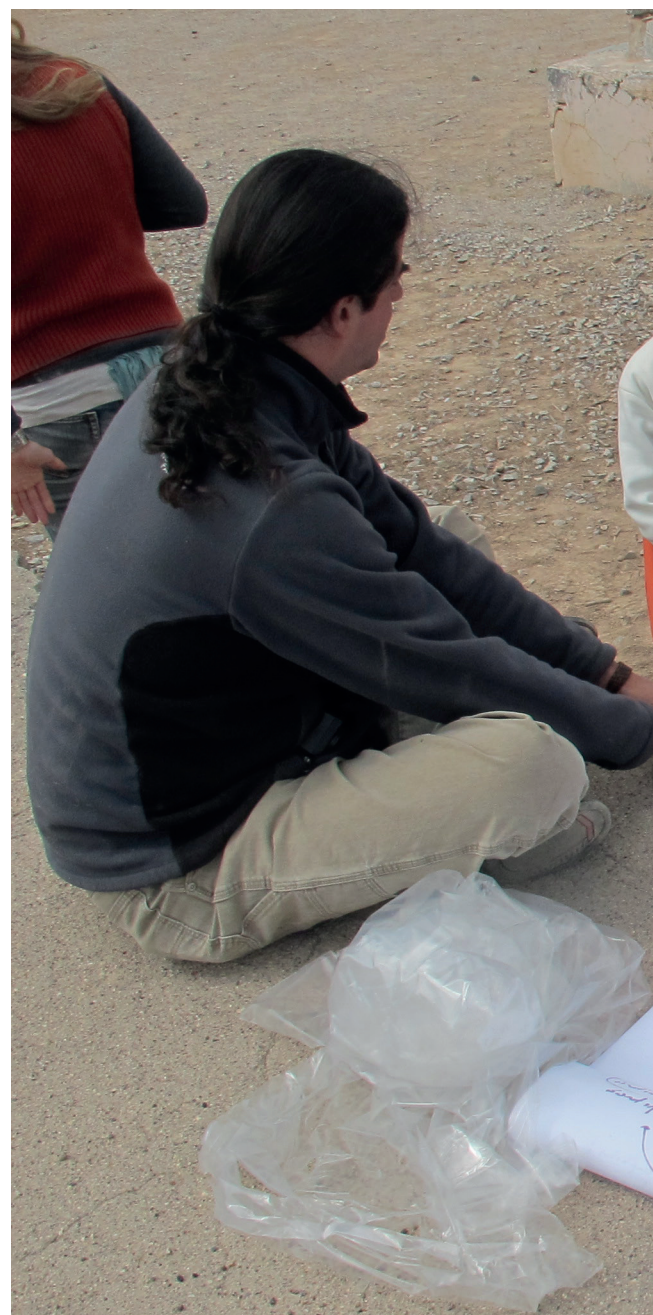
Talleres con la participación de la comunidad.