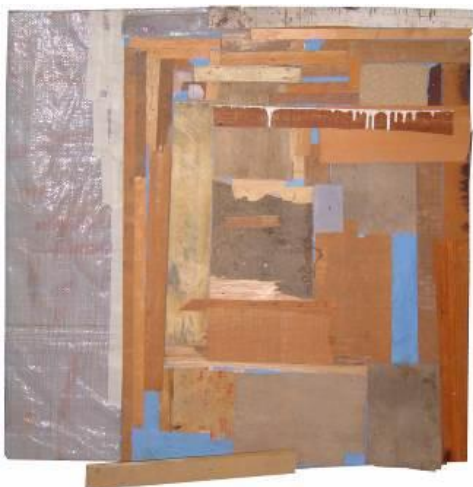
15 Pieza de Enclavado, primeras composiciones. 2003