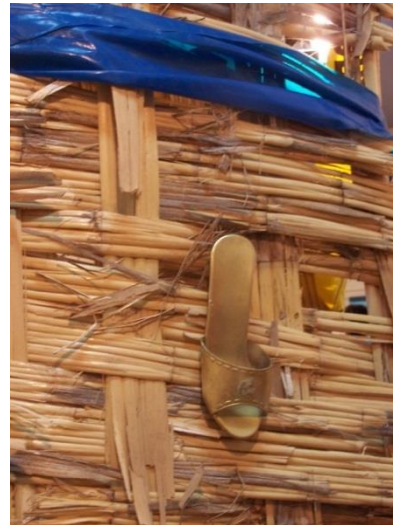
33 Pieza de instalación Enclavado. Exposición individual Mi casa en la galería de la Universidad Nacional Mayor de San Marcos.2005