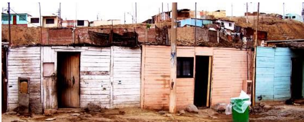
21 Visita guiada al Asentamiento Humano en Pachacutec - Callao. 2006.

Recuerdo que en esas fechas, cuando salía de mi cuadra, un vecino había decidido por fin colocar la puerta de metal en la fachada de su casa, la cual yo había registrado días anteriores. Así que, un tanto desesperada me acerqué a preguntarle si podríamos negociar su traslado a la galería de arte, me miró con cara de sorprendido y me dijo que si quería me la llevara en ese mismo momento de manera gratuita. Ante la imposibilidad del traslado, decidí por primera vez construir fachadas de tamaño original en el techo de la escuela y que estas pasaran a hacer parte del proyecto de tesis del último año en Bellas Artes. Fue entonces que, al no lograr sincronizar con la práctica pictórica de caballete dentro del taller, tuve a bien mudarme al techo de la Escuela de Arte, donde no solo reciclé material de sobra conocido como basura de techo, sino que encontré a otros estudiantes de escultura quienes pugnaban también por espacios otros.