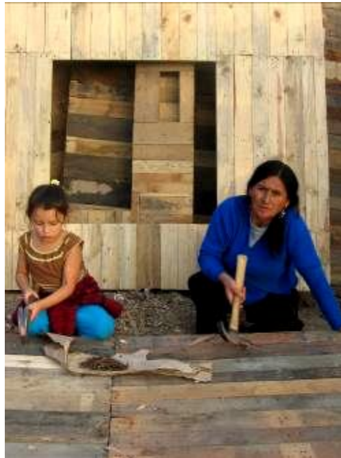
3 Pobladora de la ciudadela de Pachacutec, que construye junto con su familia casas prefabricadas para la venta. Registro 2002