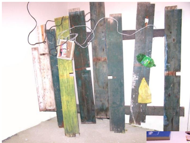
34 Pieza de instalación Enclavado. Exposición individual en la galería de la Universidad Nacional Mayor de San Marcos.