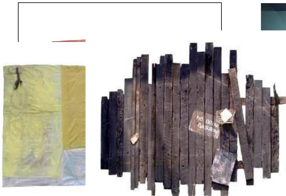
28 Pieza de Enclavado 4, Exposición colectiva en la galería del Centro Cultural de la Escuela de Bellas Artes.2004 29 Pieza de Enclavado 5, Exposición colectiva en la galería del Centro Cultural de la Escuela de Bellas Artes.2004