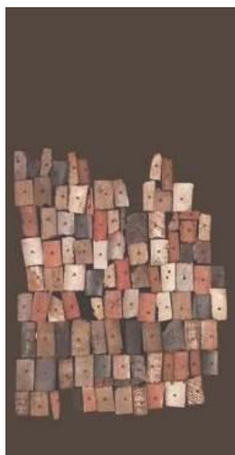
8 Piezas de Enclavado, primeras composiciones. 2003