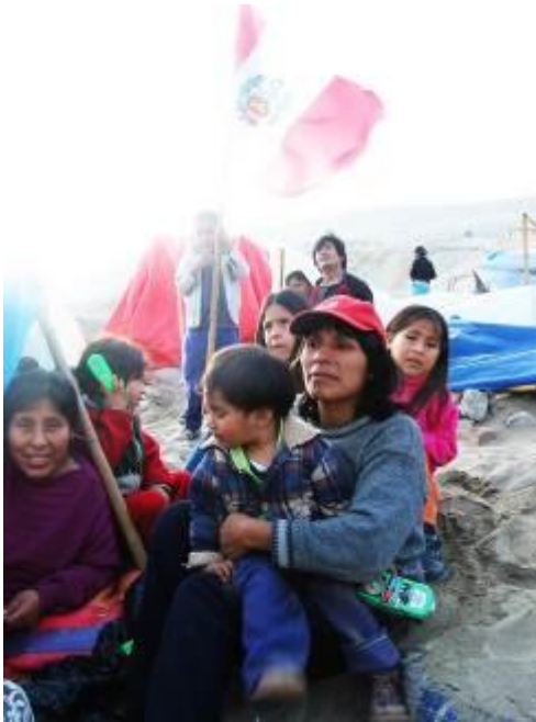
2 Primer registro de invasión o toma de terreno en ciudadela Pachacutec - Distrito Ventanilla - Callao. 2006