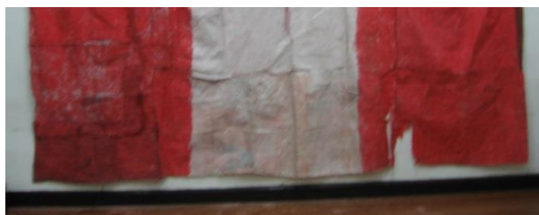
42 Pieza de Enclavado presentadas para tesis, Escuela Nacional de Bellas Artes, 2005.