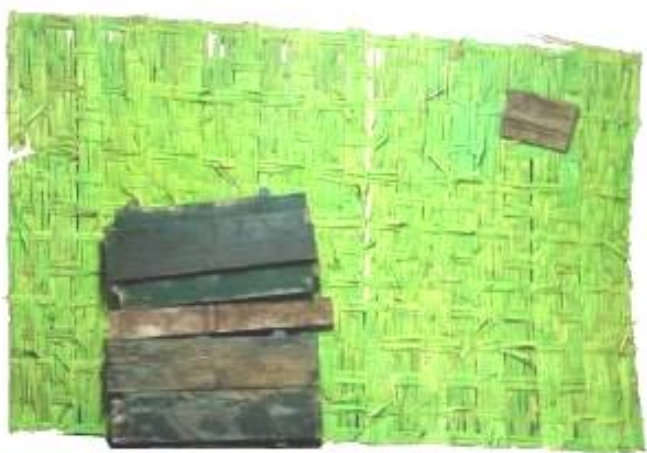
39 Pieza de Enclavado presentadas para tesis, Escuela Nacional de Bellas Artes, 2005.