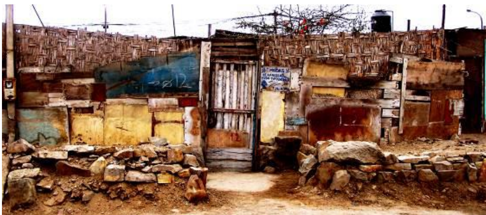
20 Visita guiada al Asentamiento Humano en Pachacutec - Callao. 2006.