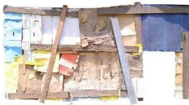
25 Pieza de Enclavado 2, Exposición colectiva en la galería del Centro Cultural de la Escuela de Bellas Artes.2004