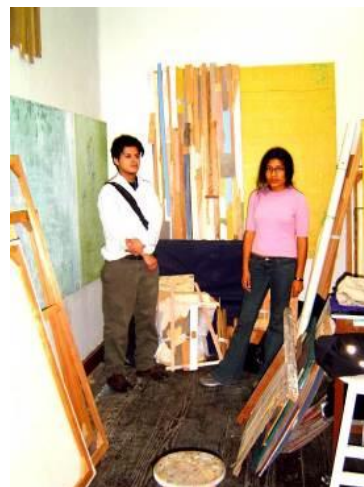
9 Taller en la Escuela Nacional de Bellas Artes. 2003