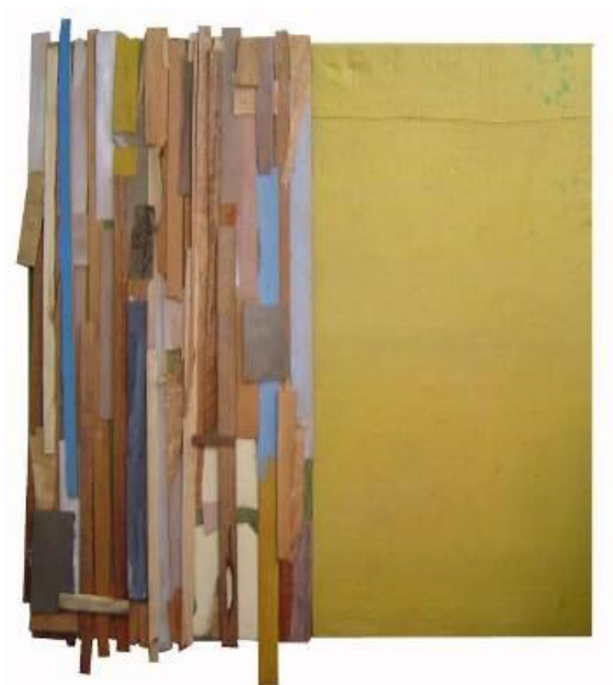
11 Pieza de Enclavado, primeras composiciones. 2003