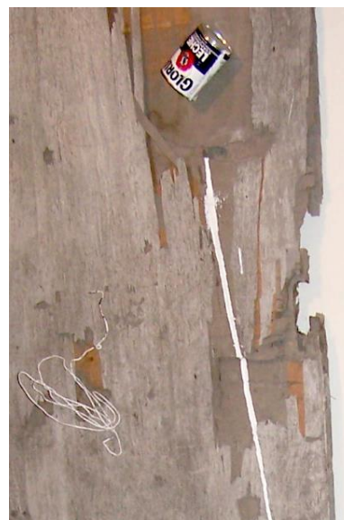
38 Pieza de instalación Enclavado. Exposición individual Mi casa en la galería de la Universidad Nacional Mayor de San Marcos.2005.