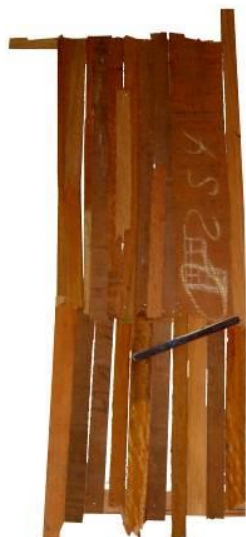
13 Pieza de Enclavado, primeras composiciones. 2003