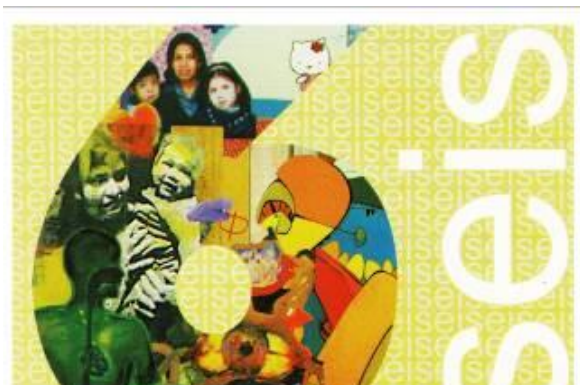
6 Exposición colectiva SEIS, en Galería Municipalidad de Pueblo libre. 2003