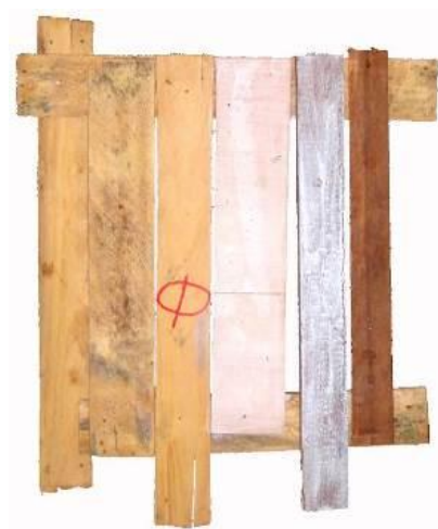
14 Pieza de Enclavado, primeras composiciones. 2003