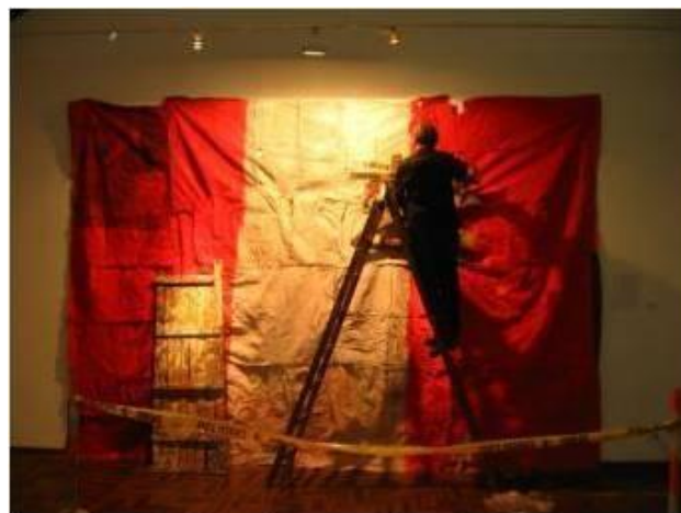
46 Instalación Hombres trabajando . Exposición colectiva, galería del Parque Reducto en Miraflores. 2006