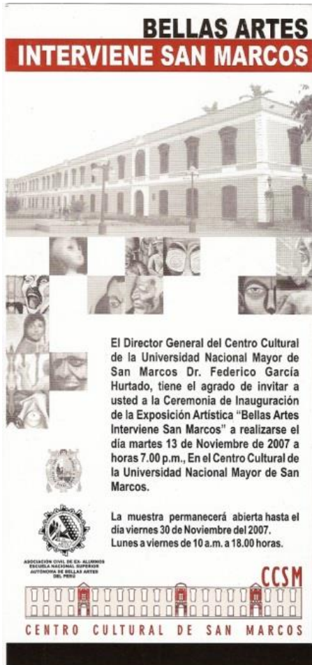
43 Exposición colectiva, Bellas Artes interviene Casona de San Marcos , galería UNMSM. Centro de Lima, 2006.