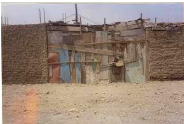
16 Fachada del mercado de mi barrio, Asentamiento Humano Hijos de Grau. Ventanilla-Callao. 2004

En el año 2004 decidí centrarme definitivamente en el hecho de que lo que me interesaba era algo muy diferente a las corrientes de arte moderno que estudiaba en la Escuela de Bellas Artes y que esto era algo creado desde mi propia experiencia y entorno habitual. Así que afiancé mis recorridos por mi barrio, donde, con cámara en mano, junto a mi padre, iba registrando con fotografía y video las fachadas de las casas de los vecinos que llamaban especialmente mi atención. De la misma manera el año 2006 empecé a programar junto a Marcelo Zevallos 7 , recorridos colectivos con colegas interesados, donde empezamos a funcionar como promotores culturales de nuevas rutas turísticas en la ciudad.