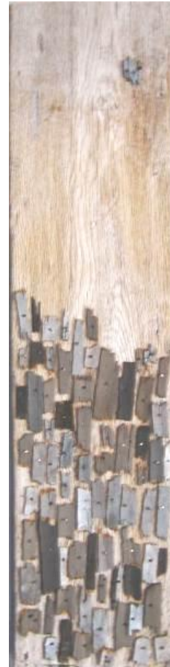
44 Exposición colectiva, Bellas Artes interviene Casona de San Marcos , galería UNMSM. Centro de Lima, 2006.