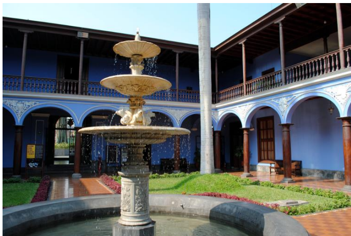
45 Casona de San Marcos, galería UNMSM. Centro de Lima, 2006