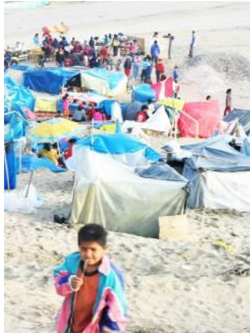
1 Segundo registro de invasión o toma de terreno en ciudadela Pachacutec - Distrito Ventanilla - Callao. 2006