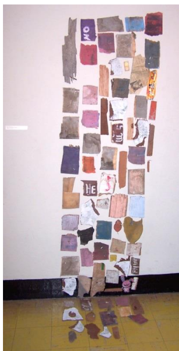
36 Pieza de instalación Enclavado. Exposición individual Mi casa en la galería de la Universidad Nacional Mayor de San Marcos.2005.