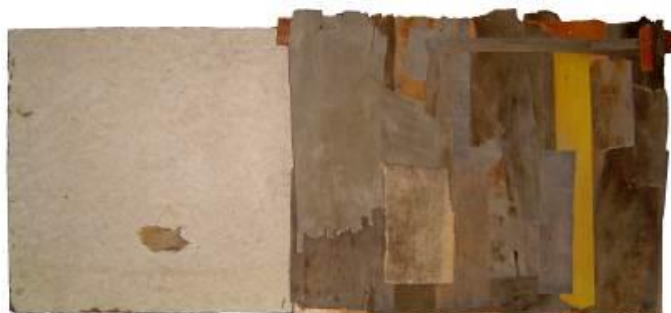
12 Pieza de Enclavado, primeras composiciones. 2003