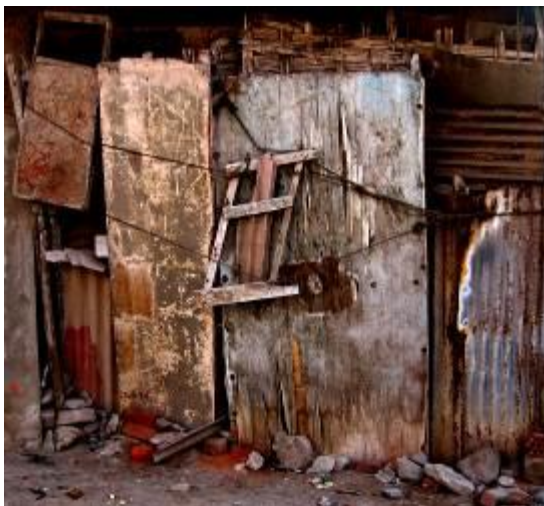
22 Fachada de mi vecino, Asentamiento Humano Hijos de Grau. Ventanilla-Callao. 2004