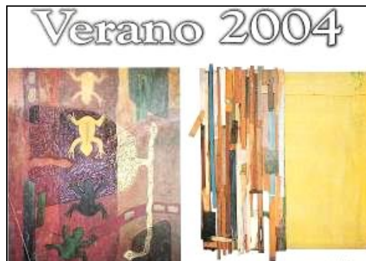
7 Exposición colectiva Verano, 2004, en Galería PetroPerú. 2004