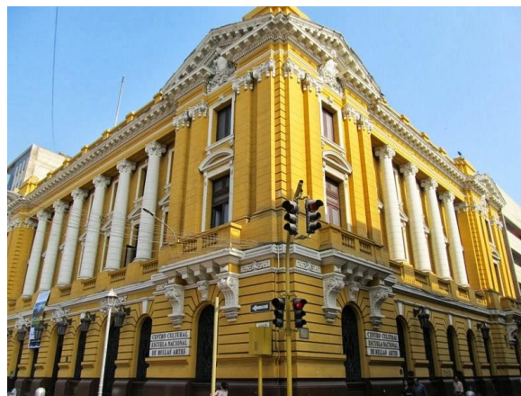
27 Centro Cultural de la Escuela de Bellas Artes.2004