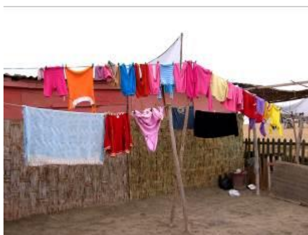
17 Fachada 1 de mi barrio, Asentamiento Humano Hijos de Grau. Ventanilla-Callao. 2004