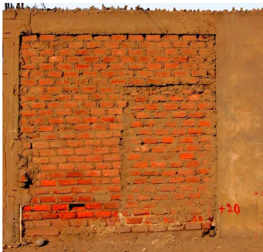
18 Visita guiada al Asentamiento Humano en Pachacutec - Callao. 2006.