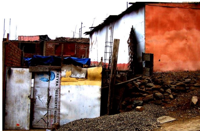
19 Visita guiada al Asentamiento Humano en Pachacutec - Callao. 2006.