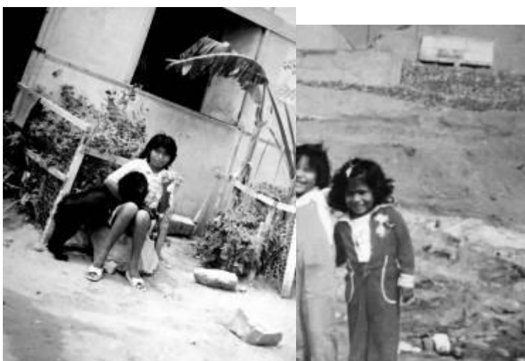
4 Aquí estoy delante de nuestra casa en el Asentamiento Humano Hijos de Grau en Ventanilla-Callao. Sujeto fuertemente a mi perra Nena a quien quise mucho y a mi gata.1992

nosotras. Recuerdo que tenía 5 años y estaba muy contenta pues como toda niña me gustaba mirar y jugar creyendo que el mundo era mágico. Con mis hermanas solíamos armar concursos en el carro a ver cuál de los autos que pasaban era el más bonito o cuántos postes faltaban para llegar hasta allá, los cuales contábamos con el dedo; hasta hoy casi sin saberlo muevo el dedo contando los postes cuando viajo en los carros en grandes recorridos. Recuerdo también el gran cuarto sin techo sobre el cerro que por años mis hermanas y yo subimos, mi padre comprando panes calientes que untábamos con mantequilla, alegres mirábamos a la gente pues todo era tan extraño, además porque lucíamos como niñas de portada con vestiditos sacados del bazar de la Marina donde mi padre se endeudaba cada mes; sin saber que mi vida cambiaría para siempre desde aquel momento. Hoy creo que si nunca hubiese vivido así por 18 años no sería lo que soy, jamás hablara del Colectivo C.H.O.L.O. con el que vengo trabajando en mi comunidad desde hace más de 7 años, tal vez mi tesis en Bellas Artes no se hubiese tratado de la arquitectura de las casas con estera-palos, en realidad no sé quién sería.