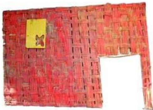
26 Pieza de Enclavado 3, Exposición colectiva en la galería del Centro Cultural de la Escuela de Bellas Artes.2004