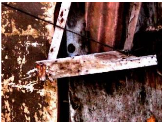
23 Fachada de mi vecino, Asentamiento Humano Hijos de Grau. Ventanilla- Callao. 2004