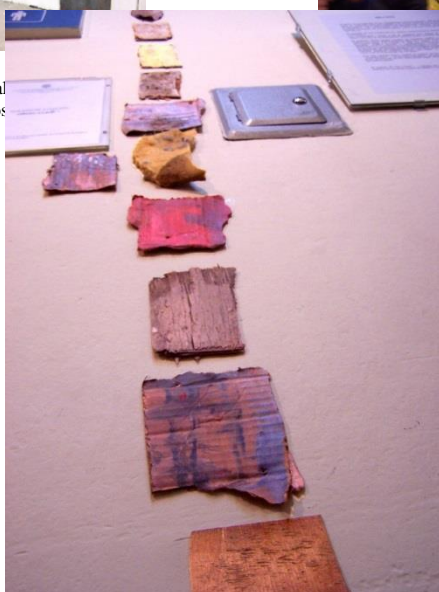
37 Pieza de instalación Enclavado. Exposición individual Mi casa en la galería de la Universidad Nacional Mayor de San Marcos.2005.