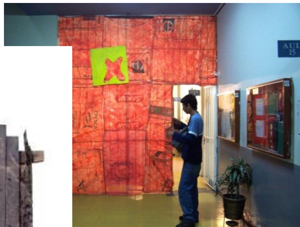
Enclavado. Exposición individual Mi casa en la galería nacional Mayor de San Marcos.2005