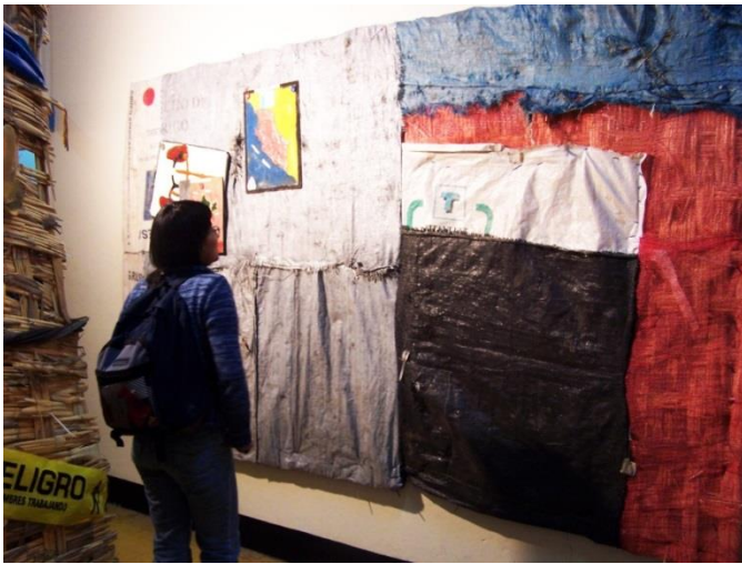
32 Pieza de instalación Enclavado. Exposición individual Mi casa en la galería de la Universidad Nacional Mayor de San Marcos.2005