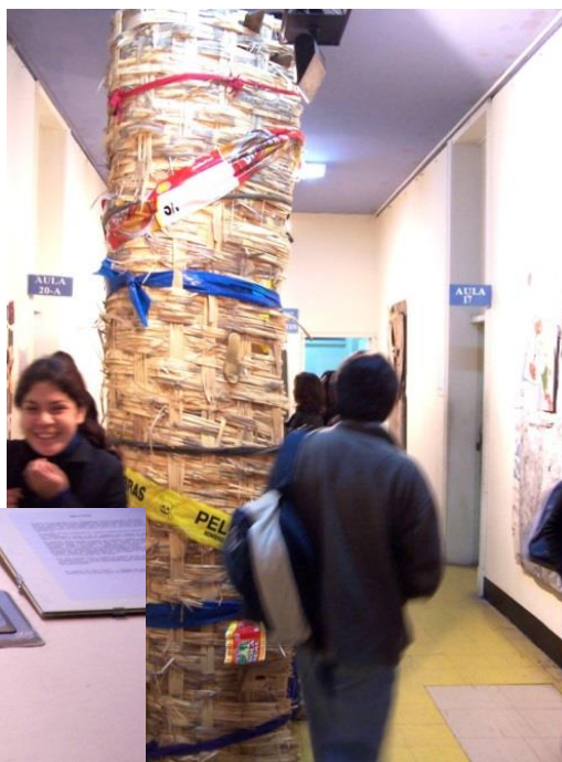
Enclavado. Exposición individual Mi casa en la galería de la Universidad Nacional Mayor de San Marcos.2005