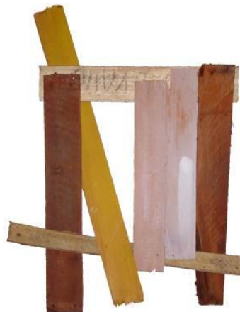
10 Pieza de Enclavado, primeras composiciones. 2003