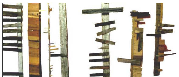
41 Pieza de Enclavado presentadas para tesis, Escuela Nacional de Bellas Artes, 2005.