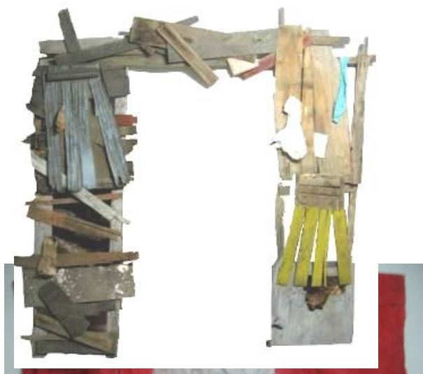
40 Pieza de Enclavado presentadas para tesis, Escuela Nacional de Bellas Artes, 2005.