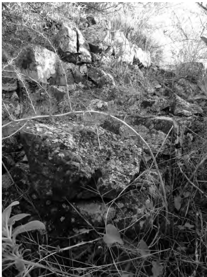
Figura 7. Zapatas de cimentación del fortín descubierto en la cumbre del cerro de Ardite.