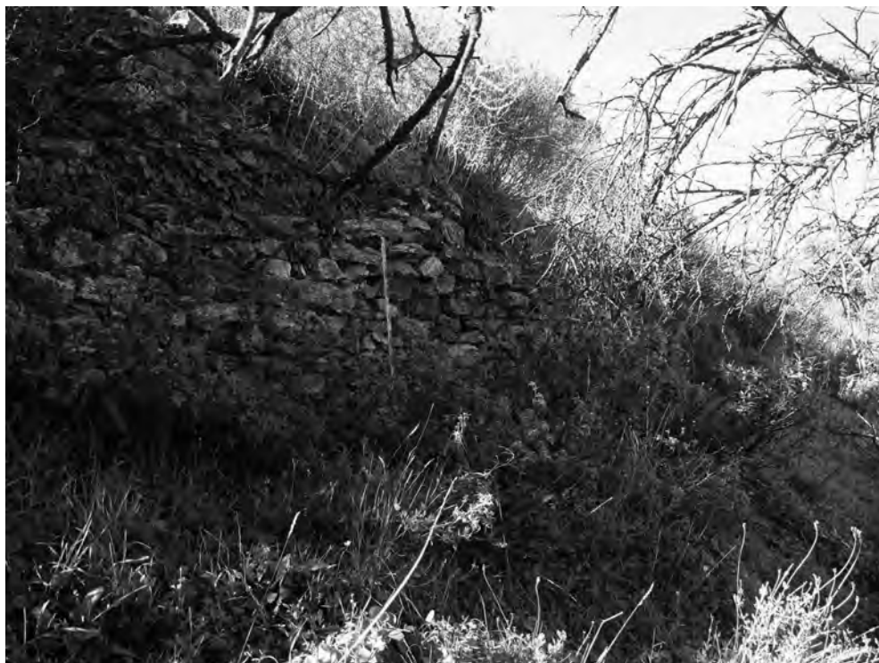
Figura 4. Estructura castral del cerro del Aljibe. Detalle del alzado en su vertiente meridional.