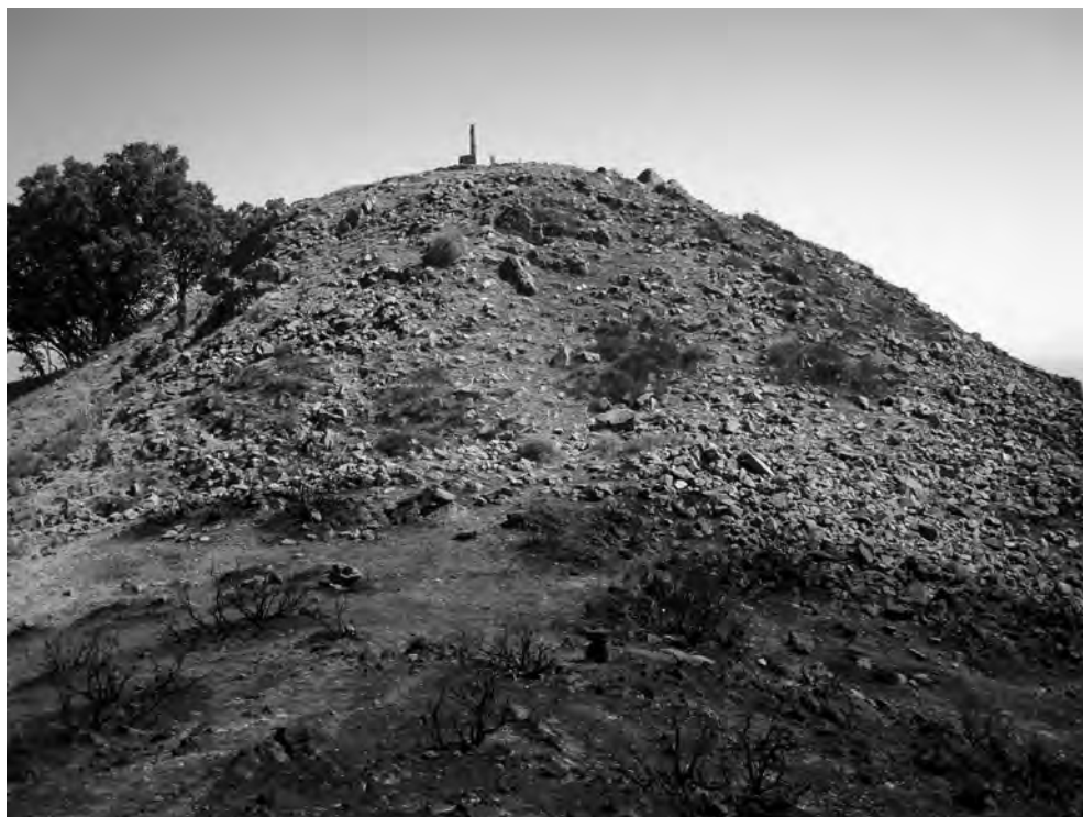
Figura 3. Derrumbes del Castillejo de las Cañas tras el reciente incendio.

En la vertiente Este, bajo unas rocas desplomadas, se advierte también una pequeña cueva con cerámica altomedieval en el interior y en su boca de acceso (920 metros de altura y UTM: 338262-4051206).