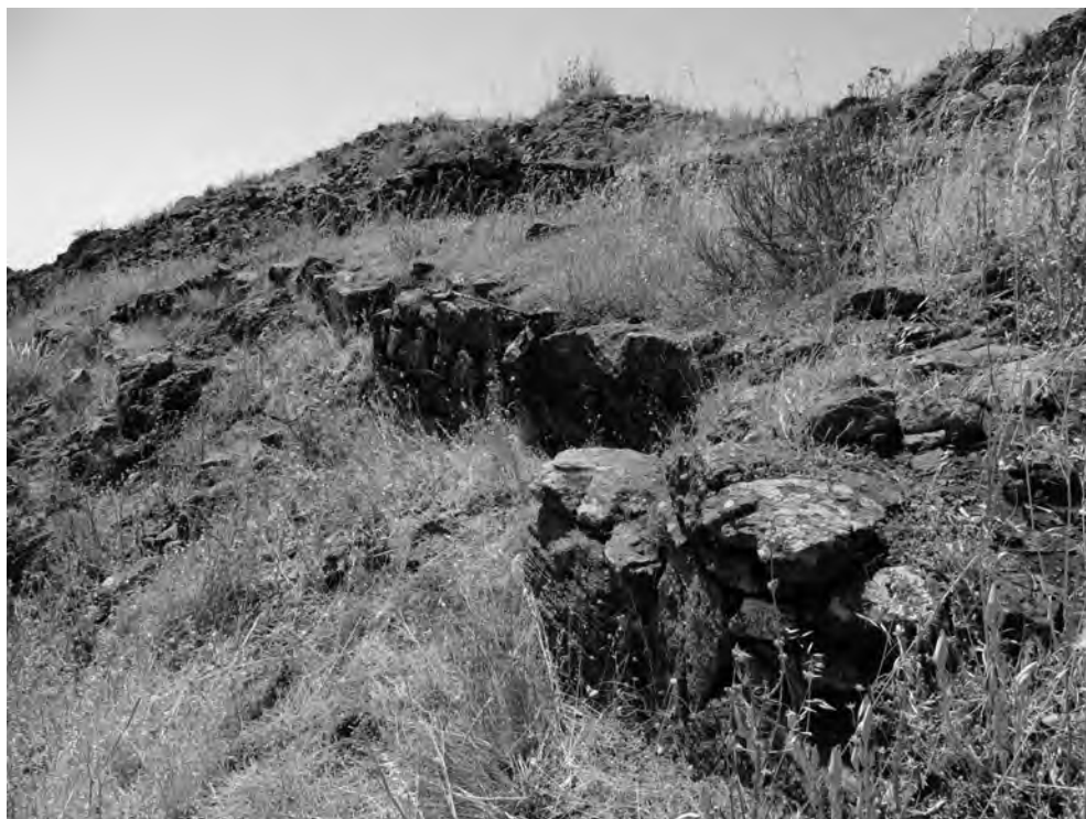
Figura 2. Restos de torre y muralla del recinto exterior de la fortaleza de Cerro Vaca.

de largo con una anchura de muro de 1'5 metros. La cerámica que aparece es de torno lento altomedieval, junto a los vidriados en verde-manganeso y los melados en diferentes tonalidades.