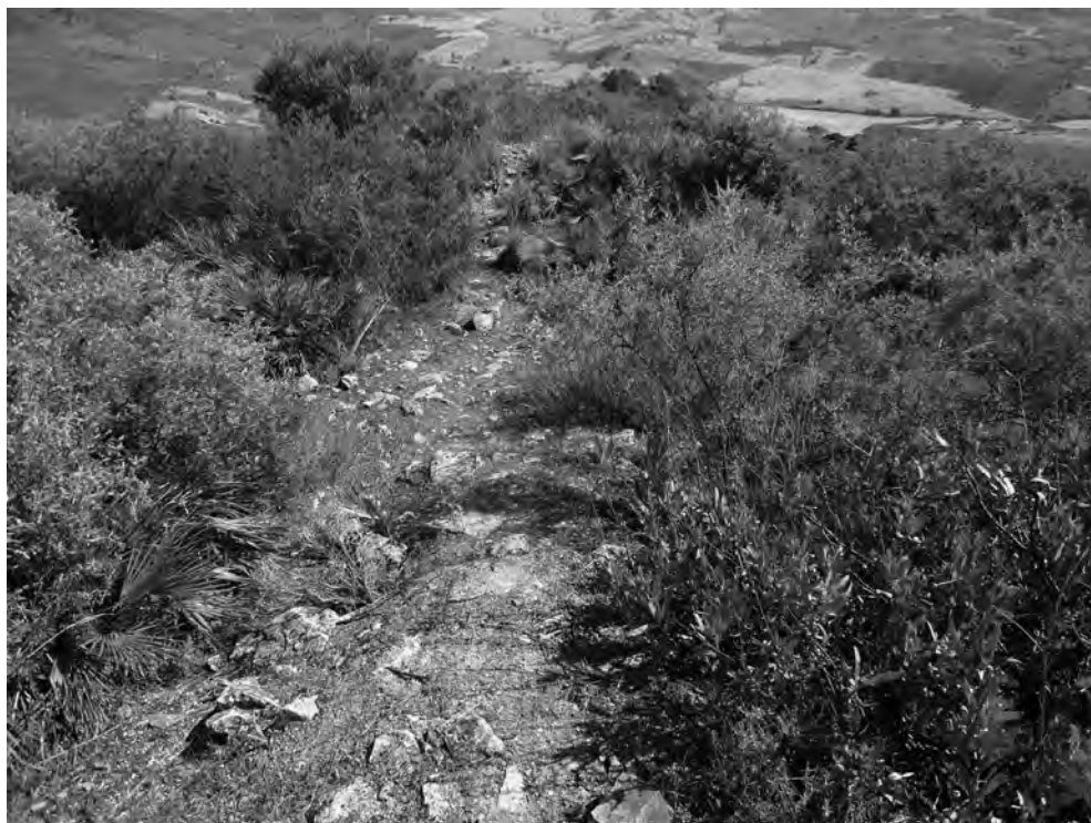
Figura 6. Hiladas a ras de suelo conectando la torre SO con el recinto cuadrangular situado en la cota máxima del cerro de Ardite.

alquería citada se corresponda con un despoblado situado a orillas del cauce fluvial, en su margen izquierda, ocupando la falda NO del cerro.