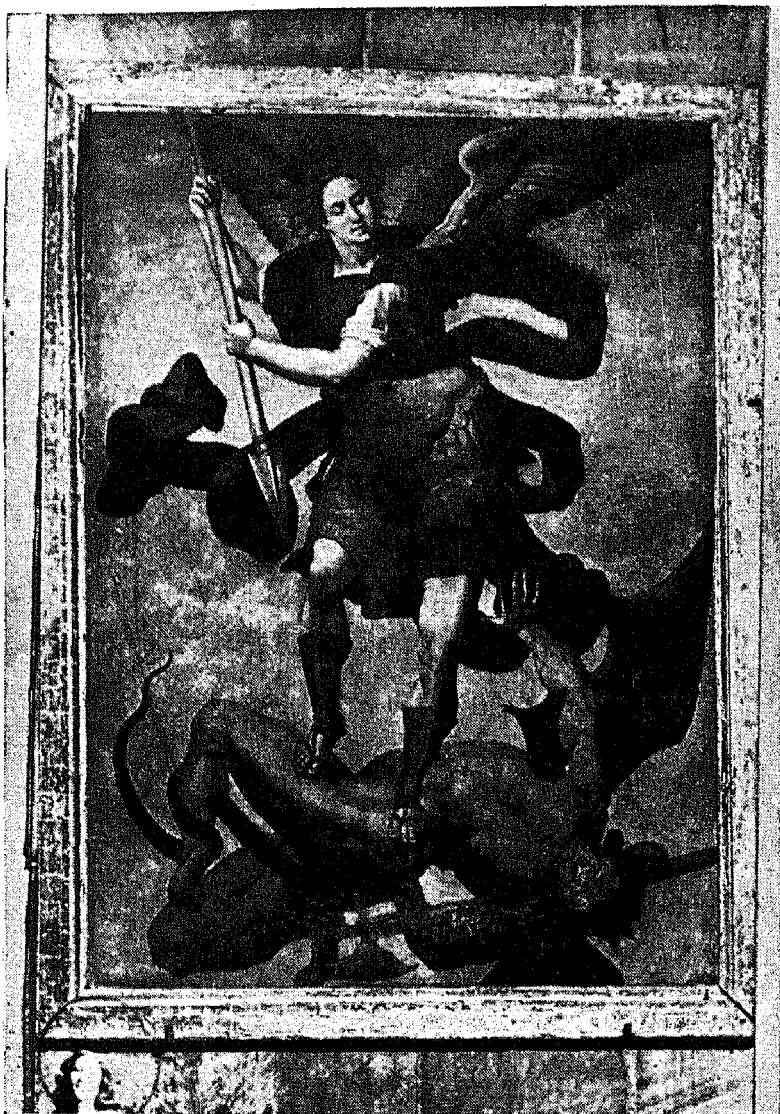
SAN MIGUEL. — CUADRO DE NAVARRETE EL MUDO EN LA IGLESIA PARROQUIAL DE BRIONES.