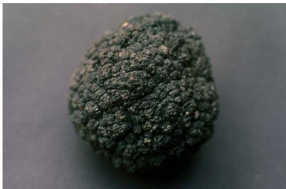
Figura 2. Brito, P. (2011). Nódulos polimetálicos o nódulos de magnesio.

Índico, Pacífico y Atlántico. La mayor cantidad de nódulos y los que contienen mayores concentraciones de minerales se encuentran en el Océano Pacífico, donde los nódulos con alto contenido de cobre y níquel pueden alcanzar