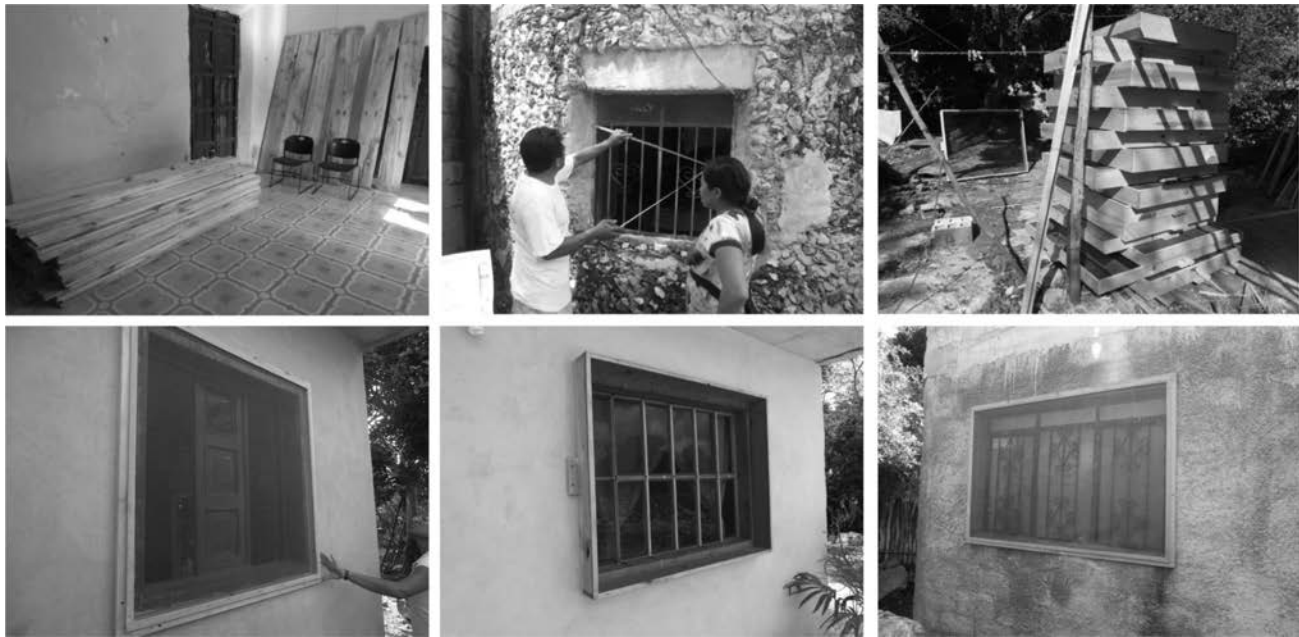
Figura 3. Fabricación e instalación de los mosquiteros para el control vectorial. Todos los mosquiteros fueron construidos en las comunidades, utilizando una malla de fibra de alta calidad con un marco de madera hecho a las dimensiones de cada ventana del cuarto.

esta intervención de ecosalud en términos de infestación de las casas, así como las percepciones de los diferentes actores sobre la intervención, los potenciales cambios en su percepción de los triatominos, de la enfermedad de Chagas y del concepto de control vectorial.