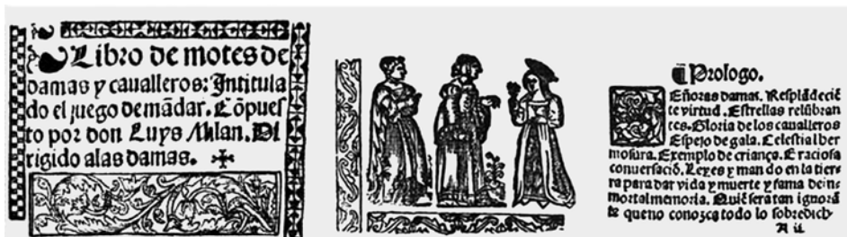
Portada i primeres pàg. de l'edició de l'edició Libro de motes de damas y caballero, amb el pròleg a les dames

s'expressa Milà a la introducció de l'obra, les dones haurien tingut un pes específic en la motivació de l'obra: