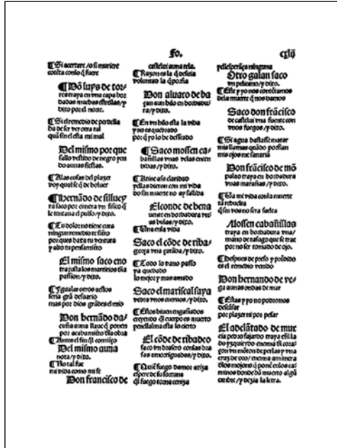
Folis que contenen els versos de la marquesa de Cotró, en el Cancionero General (1511: f. cxxxj vto)