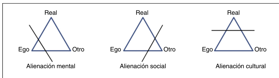
Figura 1. Esquema explicativo de la alienación según François Sigaut.