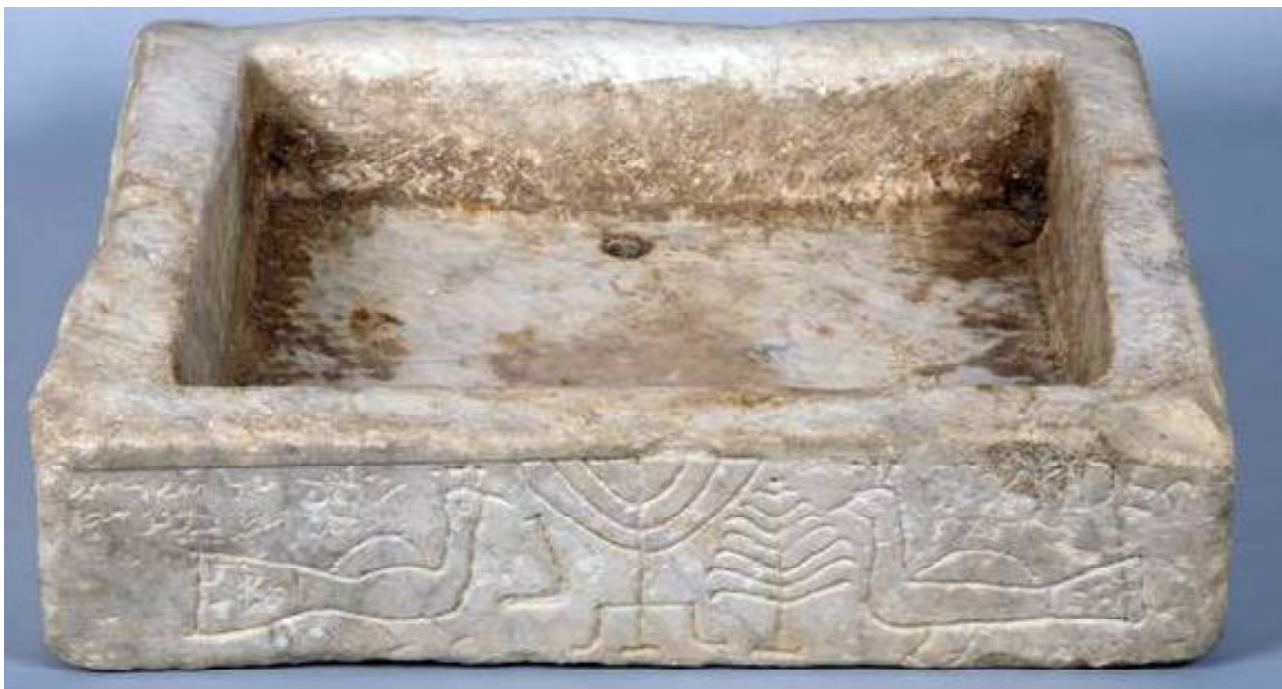
Pica trilingüe, procedent de Tarragona, (Museu Sefardí de Toledo, V-VIdC).

Relacions Catalunya-Israel d'Empresaris, el Departament de Semítiques de l'Universitat de Barcelona, el del Grup de Recerca «Chartae»-CC.TT.HH (Paleografia-Diplomàtica-Codicologia) de la Universitat Autònoma de Barcelona, l'Associació de Relacions Culturals Catalunya-Israel, la Fundació Abadia de Montserrat, la Xarxa Vives d'Universitats i l'adhesió de diversos ajuntaments. Una de les col·laboracions més productives ha estat amb l'Agència Catalana de Patrimoni de la Generalitat de Catalunya, perquè ha començat a treballar en la construcció del portal de la Xarxa de Calls que serà l'eina fonamental per fer realitat aquesta iniciativa. També és rellevant l'acord que hem arribat amb el Departament d'Ensenyament per tal d'incloure diversos projectes i tallers en les activitats escolars, i amb l'Agència de Gestió d'Ajuts Universitaris i de Recerca, per fer intercanvis d'investigadors, masters i seminaris entre les universitats d'Israel i d'aquí.