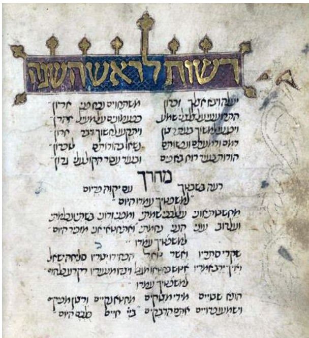
Detall del Makhazor Catalonia, ritual per celebrar el Roix Ha-Xanà i el Iom Kipur segons el ritual català. Any 1280, Barcelona Ms.