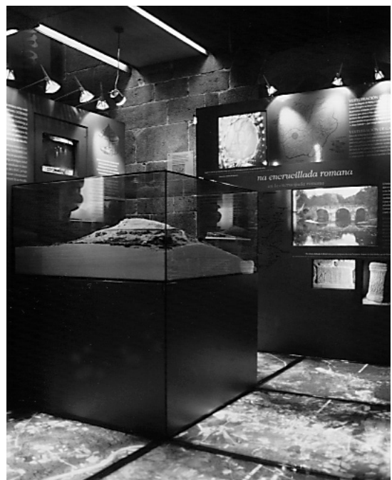
Vista xeral da sala onde se expón o mundo castrexo.

Trátase dunha carta que os veciños de Pontedevea lle enviaron ó Rei Carlos IV no ano 1805 e que no idioma propio da súa fala materna –este mesmo que eu uso– diríxense a él para lle protestar polos moitos abusos dos que aquela poboación rural era obxecto por parte dos colaboradores de impostos e de outros funcionarios por mor da imposición de “4 maravedís en cada cuartillo de viño”.