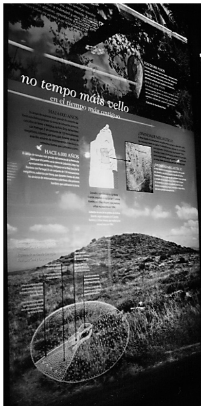
Reproducción fotográfica da Mota Grande, situada na serra do Leboreiro e do gravado idólitico que garda no seu interior.

búbalo –hoxe Terras de Celanova- baixo o monte Leboreiro é todo canto recolle este pequeno pero fermoso recanto que outrora foi lar da raíña moura e hoxe serve de non menos fermoso fogar para a nosa lonxeva memoria.