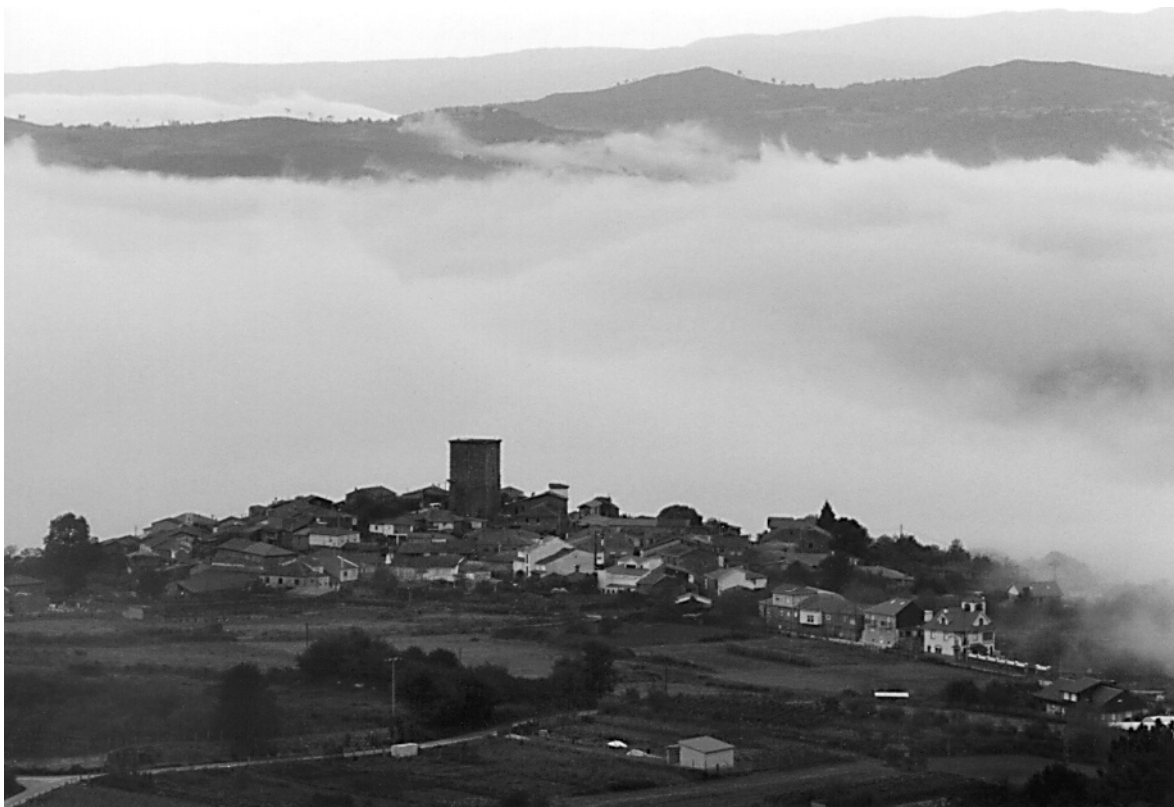
Vista xeral de Vilanova dos Infantes antes da restauración da torre.