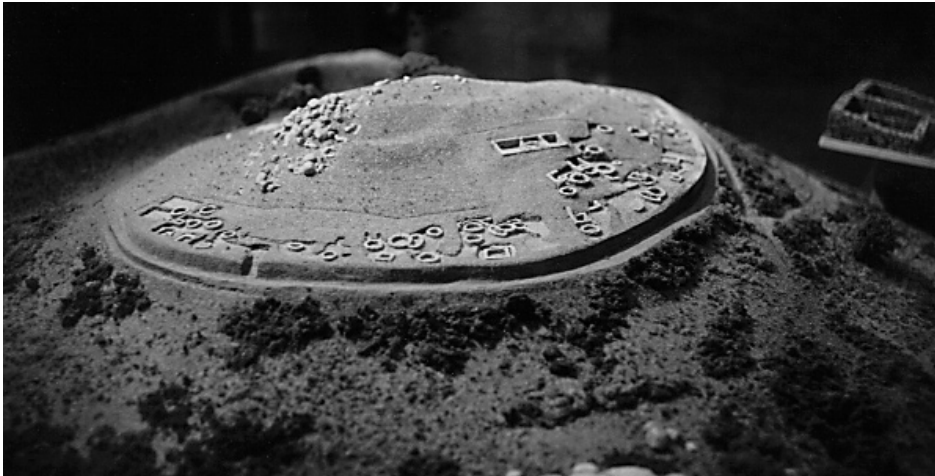
Vista superior da maqueta de castromao coa casa estudiada por Xocas ó fondo.

A carta, que foi recuperada no seu momento por Filgueira Valverde, vai asinada por "Pedro de Cimadevila, labrego do lugar de Trado" e constitúe, segundo alí mesmo se pode ler, "unha peza única ha historia das nosas letras" e un verdadeiro acto de denuncia civil que logo, con tanto tesón continuarían coas súas letras rimadas, primeiro Manuel Curros Enríquez e despois Celso Emilio Ferreiro.