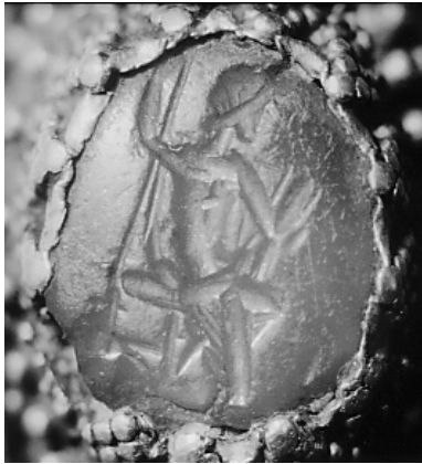
Anel de San Rosendo coa imaxe inédita de Xúpiter.

Toparémomos aquí cunha visión xeográfica xeral da comarca e cunha ampla maqueta a través da cal a guía nos explicará onde agacha a Terra de Celanova –coma a propia princesa moura da torre– as súas trabes de ouro e de alquitrán –é dicir, os tesouros– da comarca, así como outros moitos datos de cada un dos dez concellos que a conforman.