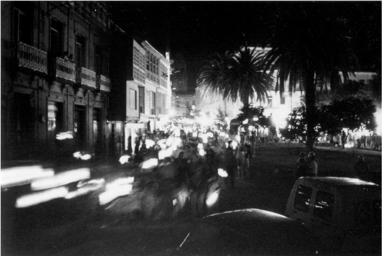
Na noite do primeiro sábado do mes de agosto, a xeito de inicios destas festas celébrase unha procesión nocturna...

polas dos mesmos, sendo o único elemento de iluminación da vila, xa que logo, as luces públicas e o alumado exterior queda totalmente apagado, dándolle así unha volta a toda a poboación, iniciando esta pola rúa de Abaixo e circundando a capela da virxe que lle dá o nome á festa. A procesión faise acompañar de charangas, gaiteiros, bandas de música e cantos, celebrando así un ritual único en toda Galicia, que conta cun grande enraizamento, non só na Terra de Celanova, senón en toda a provincia de Ourense.