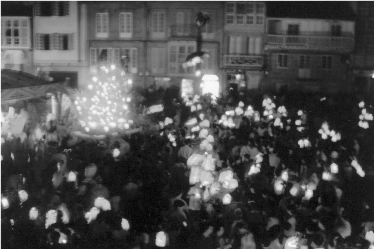
Entre a floración dos ramos, a fuxidia luz dos farois e a música, amásase un “cóctel” realmente festeiro e cultural.