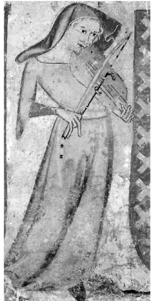
Detalle de retablo medieval «Pasión de Cristo» de Juan Oliver. 1330

Por outro lado afianza a Galiza en terreos de investigación máis aló da súa propia área xeográfica.