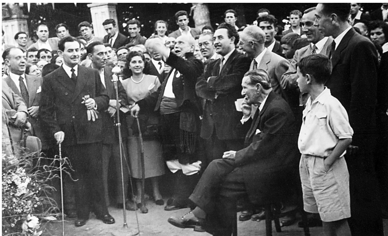
Outro momento do acto inaugural do monumento coa intervención dun compoñente dun dos coros que participaron no centenario, interpretando un dos poemas musicados de Curros Enríquez.