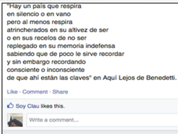
Imagen N 2

En una visualización de imagen en blanco y negro, que simboliza ideologías sin partido se presentó el documental Este es nuestro momento (Lacos, 2012). El texto expresa una variedad de voces y figuras juveniles vestidos de blanco que orientan al votante, sobre una guía de pasos, para tomar la decisión de cambiar políticamente a través del voto. El texto visual se construye sobre encuadres de medium shots . El blanco se coloca como una equivalencia de la neutralidad partidista.