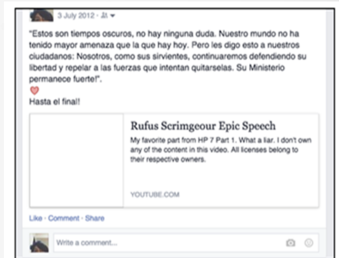
Imagen N 1

Lizarazo lo explica así: "Si las dimensiones pueden comprenderse como modalidades de relación fruidor-obra, no debemos asumir su organización como una estructura lineal, sino como un campo de relaciones simultáneas que serán restituidas en cualquier orden de la experiencia semiótica y estética que constituye su fruición." (Lizarazo, 2004, P.86). Si se mira la producción de los textos juveniles, generados durante este proceso, como extensión articulada de los actores juveniles, lo que se mira también es una condición sensible a sus experiencias.