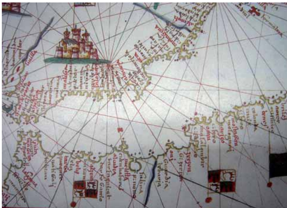
Fig. 5. El mar de Castilla. Portulano de Joan Martines 1570.

costoso de las mismas 73 , se iban realizando según apretaban las circunstancias. Ante el temor de un nuevo cerco, se decide enviar a Melilla al capitán Miguel de Perea, experto artillero, entendido también en fortificación [6].