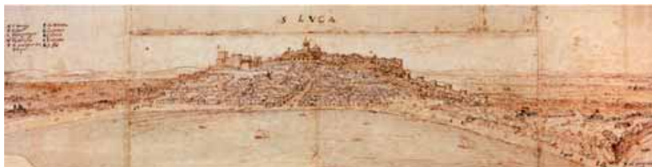
Fig. 4. Vista de Sanlúcar en 1567, por Anton Van den Wyngaerde.