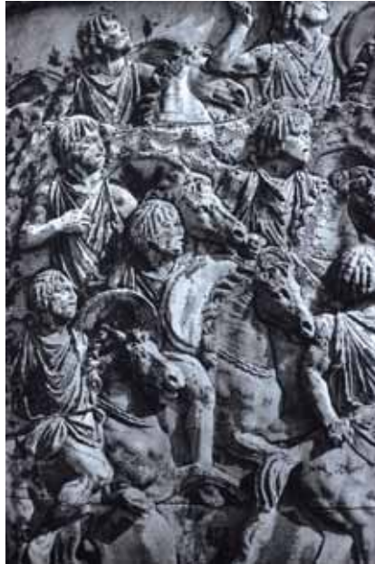
Fig. 6. Caballería maura en combate (Columna de Trajano, 114 d.C.).

La muerte del rey maselio Gaia, obligará al joven Masinissa a regresar a sus territorios (App., Pun., II, 10) para solventar problemas sucesorios, el cual combatía en Iberia. Dicho trayecto se hacía complicado pues tenía que atravesar el reino masaesilio de su enemigo Sifax. Para esta misión, en el año 204 contará con una escolta de 4000 jinetes mauros cedidos por el rey Baga de Mauretania para atravesar el reino de su enemigo [6], una fuerza exclusiva para ser utilizada para su protección y no para combatir (Liv., XIX, 30).