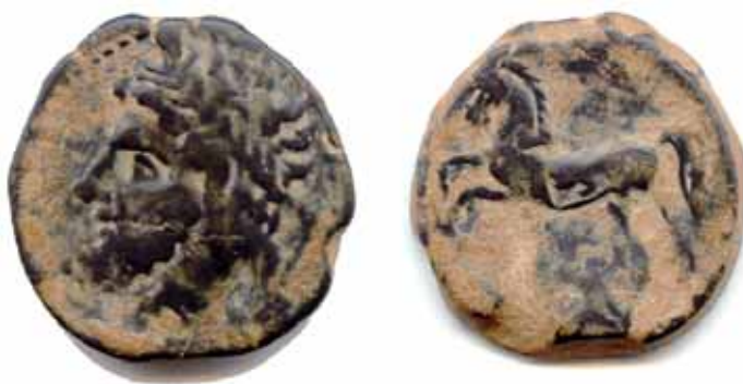
Fig. 7. Moneda de Masinissa localizada en Rusaddir (Museos de Melilla).

Sifax recibirá embajadores de Lacumazes, el nuevo rey de Maselia, un niño sometido a Mazetulo, el cual había acabado con Capusa, hijo mayor de Gaia (Liv., XIX, 23) 19 . Un encuentro entre ambos reyes que será retrasado al ser su séquito interceptado por Masinissa en Tapso (Ras Dima, Túnez) pero tras el imprevisto fue reanudada la marcha (Liv., XIX, 30). El apoyo mostrado por sus enemigos al nuevo orden, animará a los seguidores de Masinissa a la lucha contra Mazetulo, en cual contaba para su defensa con tropas auxiliares masaesilias. Finalmente Mazetulo será derrotado en batalla, tornando el reino de Maselia el heredero Masinissa, ofreciendo el perdón a niño y mentor (Liv., XIX, 30).