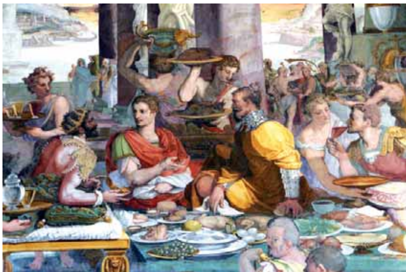
Fig. 5. Recibimiento de Escipión por Sifax. (Villa di Poggio a Caiano, sala di Leone X, Andrea del Sarto e Alessandro Allori, Tributo a Cesare, 1580 d.C.).

Finalmente Escipión y Sifax acordaron un pacto privado 11 en su capital, tras trasladarse desde Cartago Nova en dos quinquerremes, en la que pondría su vida en peligro por cerrarlo (Liv., XIX, 24) 12 . Un encuentro que coincidirá con la escuadra de Asdrúbal Giscón en las costas de Siga que regresaba de la batalla de Ilipa, en la cual había sido vencido por los romanos y suponía la renuncia de Cartago de la península (App., Hisp., XXX).