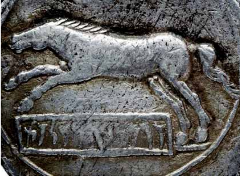
Fig. 3. Detalle de caballo galopando en el reverso de una moneda de Vermina, hijo de Sifax (Biblioteca Nacional de Francia).

nes sobre tácticas de guerra con los tres centuriones enviados. Según nos relata Livio uno de ellos se quedaría como instructor militar para apoyar la lucha contra Cartago llamado Quinto Estatorio 5 (Liv., XXIV, 48 y XXX, 11 y 28). Aunque el territorio nùmdida contaba con buenos jinetes que eran entrenados desde su más tierna infancia 6 [3], su reino carecía de cuerpo de infantería a diferencia de las fuerzas enemigas que se componía principalmente de estos. Tras ser adiestrados los masaesilios por este centurión 7 entablaron un primer combate contra fuerzas cartaginesas que concluirá con la victoria de Sifax (Liv., XXIV, 48).