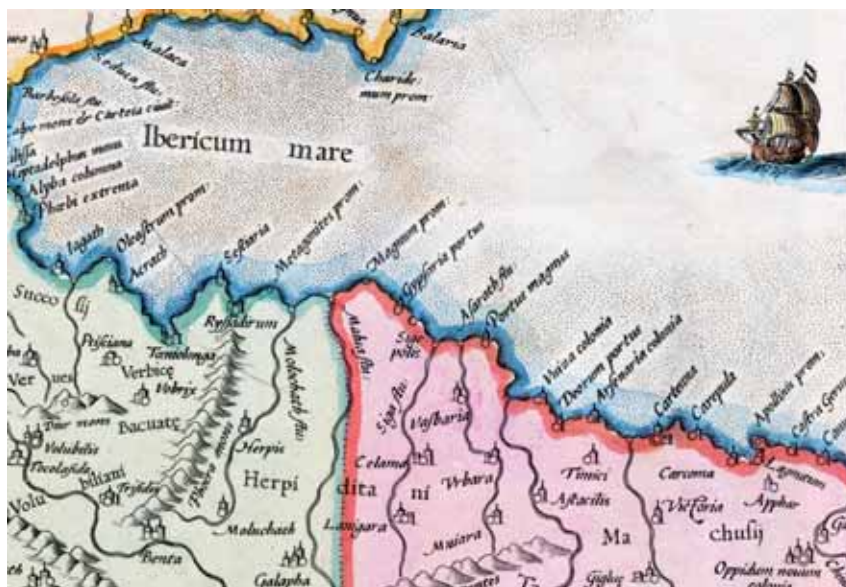
Fig. 2. Mapa de Gerardus Mercator (1578) basado en la Geografía de Ptolomeo donde se señalan las ciudades de Rusadir y Siga.