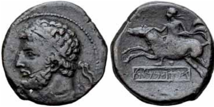
Fig. 4. Anverso y reverso de una moneda de Sifax (Biblioteca Nacional de Francia).

Masinissa después de haber luchado en el bando cartaginés, en el año 206 a.C. contraía un acuerdo secreto con Junio Silano tras la desastrosa derrota en la batalla de Ilipa (Alcalá del Río, España), lugarteniente de Escipión, extendiéndolo poco después con el propio general romano (Liv., XVIII, 16, 17 y 18). El motivo según Apiano de este pacto con Escipión sería la ruptura por parte de los cartagineses de la promesa matrimonial entre él y Sofonisba (App., Hispan. , XXXVII y App., Pun. , II, 10 y 11).