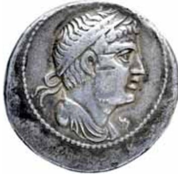
Fig. 10. Anverso de una moneda de Vermina, hijo de Sifax (Biblioteca Nacional de Francia).

otorgar la paz (Liv., XXXI, 11). En el año 200 a.C. Vermina se reunirá con los embajadores romanos tras visitar Cartago para que pusieran por escrito las condiciones de paz, asegurando que cualquier clase de paz con Roma la consideraría justa y ventajosa, entregándose los términos e indicándole que enviase delegados a Roma para ratificar la paz (Liv., XXXI, 19) [10].