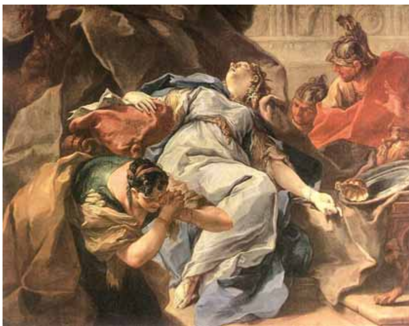
Fig. 8. Muerte de Sofonisba de Giambattista Pittoni (Pushkin State Museum, Moscú, Rusia).

En el año 203 a.C. Sifax será encarcelado en Alba Fucens 25 (Massa d'Albe, Italia) y todo indica que no presencié la marcha triunfal en el año 201 a.C. pues murió poco antes en Tibur (Tívoli, Italia), lugar al que fue trasladado desde Alba Fucens [9]. Esta ausencia en el triunfo 26 romano choca con Polibio al que cita el propio Livio, afirmando que sí estuvo 27 . El funeral de tan importante enemigo fue de carácter público, constituyendo en sí mismo otro espectáculo (Liv., XXX, 45).