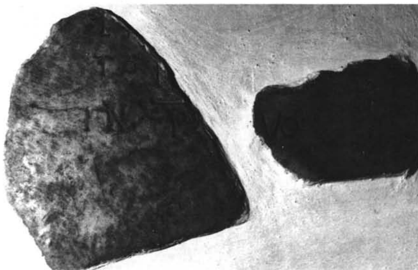
LÁMINA V. Frafrmentos de inscripciones visigodas