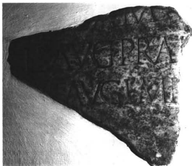
LÁMINA II. Inscripción honoraria (terminus Augustalis de Fita)