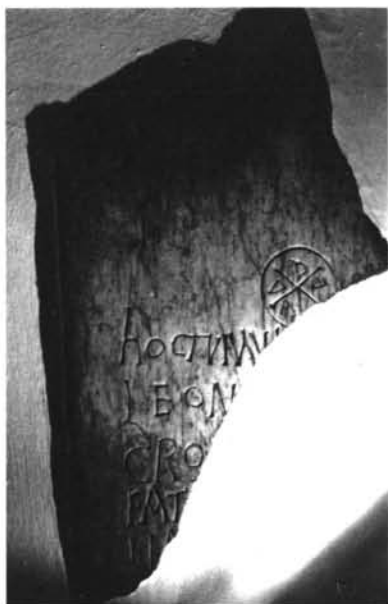
LÁMINA IV. Inscripción de Herbulius?