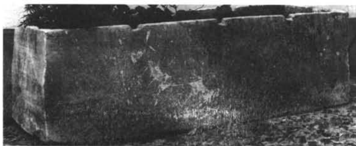
LÁMINA I. Material arqueológico de la dehesa de El Santo