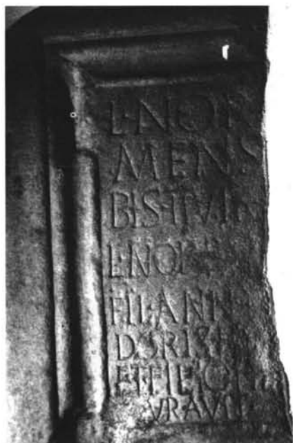
LÁMINA III. Inscripción de L. Norbanus