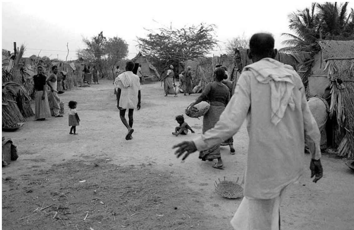
Un campo de trabajo para trabajadores atados por deudas en Andhra Pradesh.

los contratos públicos. Adquirieron maquinaria gradualmente, como camiones de volteo, que alquilan en los sitios de construcción contratados por sus compañeros de casta. Esta actividad, más lucrativa, más fácil y considerada moderna y “más limpia” que el manejo directo de la mano de obra, los animó a delegar las actividades laborales en los maistris de castas inferiores, en especial Gollas. Esto exige una proximidad directa con los trabajadores, indigna de la posición social cambiante de los Reddys: