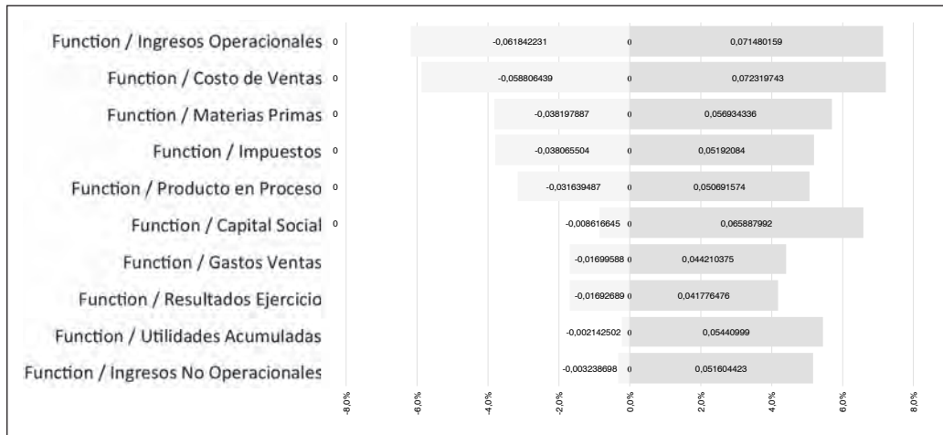
Ilustración 4. Coeficientes de Regresión para la Obtención del ROE por Análisis Dupont