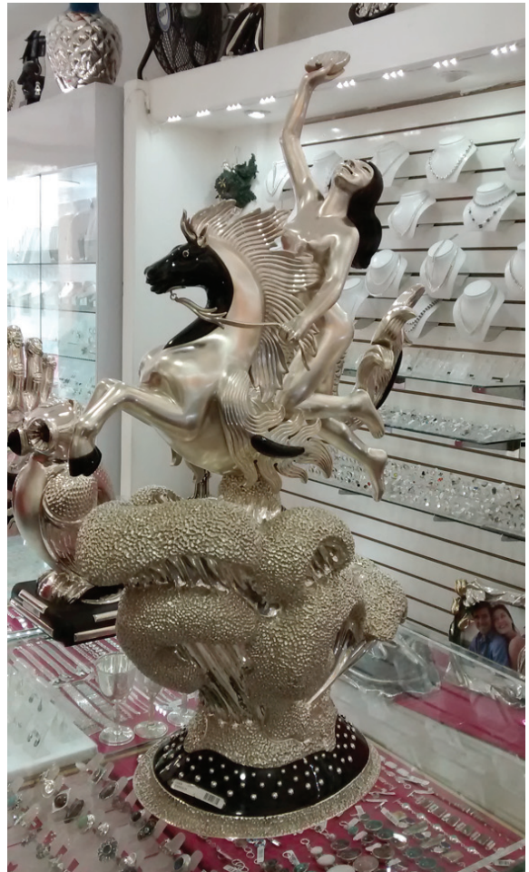
Figura 4. Artesanías exclusivas de plata