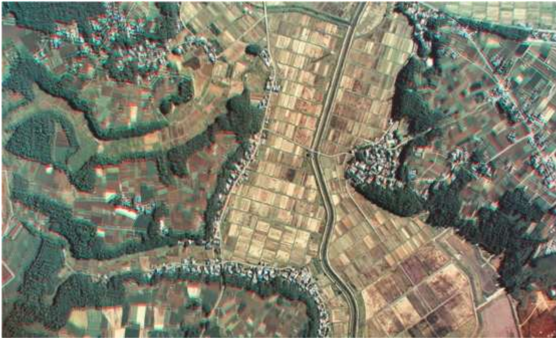
Figura 01: Terceira imagem trabalhada no workshop : Imagem de satélite da província de Chiba, Japão.