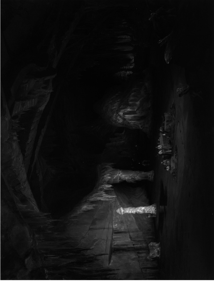
Imagen 1. Jean-Baptiste-Louis, barón Gros (Ivry-sur-Seine, Isla de Francia, Francia, 1793-París, isla de Francia, Francia, 1870). Grutas de Cacahuamilpa , 1855, óleo sobre lienzo, 101.1 × 150.7 cm; con marco, 159.6 × 168.6 × 13.3 cm. Colección Museo Soumaya. Fundación Carlos Slim A. C./Ciudad de México. Procedencia: Francisco González de la Fuente; Antonio Carrillo Flores; Antigüedades y Galerías La Granja, Ciudad de México, México; colección particular; casa de subastas Sotheby's, Nueva York, Estados Unidos, 2003.