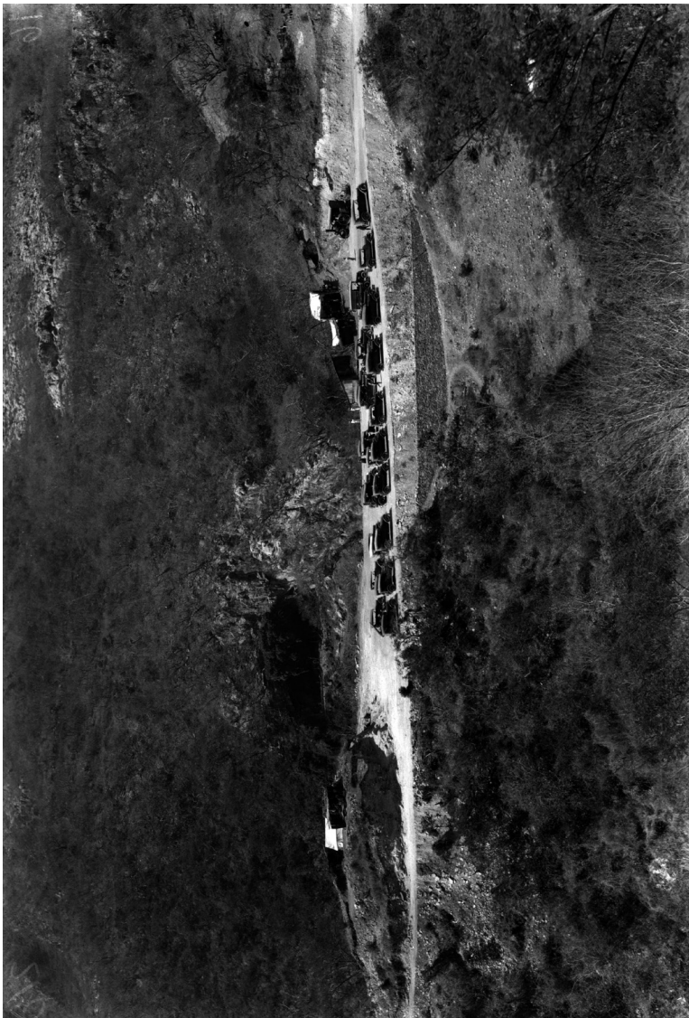
Imagen 3. Automóviles estacionados en la entrada de la gruta de la guta de Cacahuamípa. Archivo Casasola, 1921. © núm. 451, CONACULTA.INAH.SINAFO.FN.MÉXICO. "Reproducción autorizada por el Instituto Nacional de Antropología e Historia".