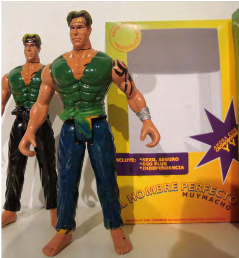
Fig. 8 y 9