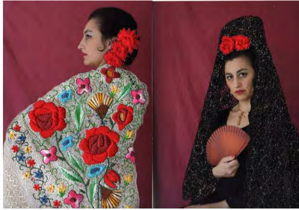
Fig. 2 y 3