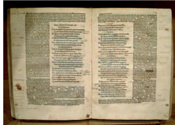
Figura 2. Incunabulo de los Epigramas de Marcial, editado en 1490 en Milán por Udalricus Scinzenzeler. Archivo del Gobierno de Aragón.

Difícil, pero posible. Siempre habrá un motivo si lo buscamos. Una anécdota casual, una coinci-