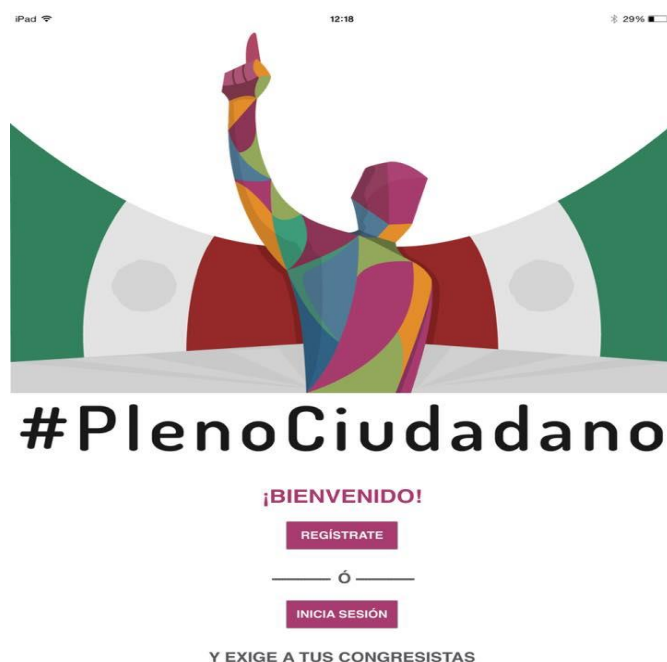
Figura 1. Carátula PlenoCiudadano

PlenoCiudadano es una plataforma tecnológica que se lanzó el lunes 7 de septiembre del 2015. Es una aplicación diseñada para usuarios de dispositivos Android y Apple que se puede descargar de manera gratuita de Google Play y de App Store, respectivamente (Figura 1).