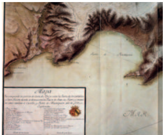
(Figura 5) La costa de Orán.

El maestre de campo Juan de Villalba era hijo de Cristóbal de Villalba "capitán de peones" de la infantería del Gran Capitán, junto al que combatió en las guerras de Italia. En 1506 siendo coronel, Cristóbal obtenía de Fernando II, rey de Aragón, la concesión de escudo de armas por su participación en la toma de Andarax (Almería) y su comportamiento en las guerras del reino de Nápoles, en la isla de Corfú (Grecia), y otros hechos de armas 17 . Establecido en Plasencia, donde sería regidor, fundó mayorazgo sobre ciertas tierras que tenía en el término de dicha villa, en cabeza de su hijo primogénito