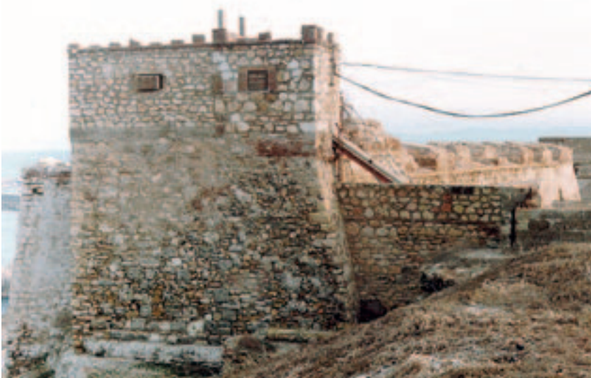
(Figura 8) El fuerte del Rosario.

Durante su mandato en Melilla, se iniciaron las obras de fortificación del “cuarto recinto” construyéndose los fuertes de Victoria Grande, Victoria Chica y Rosario, obras que ampliaban el perímetro defensivo de la plaza eliminando la pesadilla del padrastrero que dominaba la plaza, reconstruyéndose también el fuerte de San Miguel en la zona de las huertas. Entre las obras civiles que se acometieron en su tiempo destaca la construcción del hospital del rey, y las mejoras llevadas a cabo en la iglesia parroquial, a la que se dotó con un retablo [8].