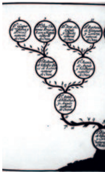
(Figura 14) Ascendientes melillenses de Francisco Villalba Cortés. AHN. Estado. C.III, ezp.571.

En junio de 1791, siendo Caballerizo de campo de su majestad, era nombrado caballero de la Orden de Carlos III.