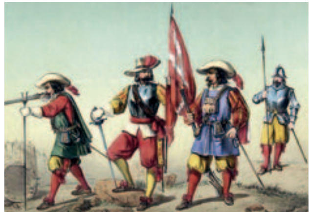
(Figura 3) Tropas de Infantería Española. Siglo XVI.