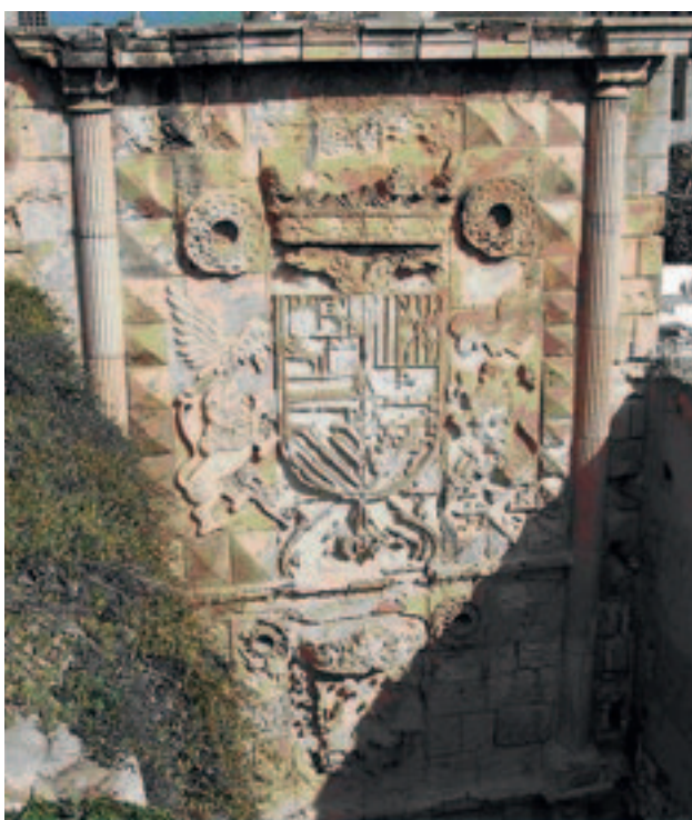
(Figura 6) Alcazaba de Orán. Puerta de España.

Juan de Villalba y Trejo 18 . Comendador de la orden de Santiago, en 1512 el duque de Alba le concedía por sus servicios la tenencia de la ciudad de Estella y sus castillos y del gobierno de su merindad. A su muerte, acaecida en 1516, le sucedería en el cargo otro de los hijos tenidos en su matrimonio con Estefanía Trejo 19 , Pedro Bermúdez de Villalba, coronel de infantería, que se distinguiría en la defensa del reino de Navarra.