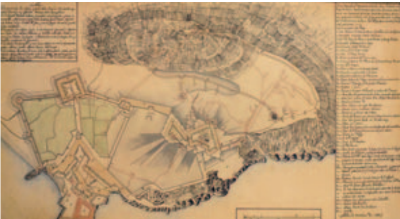
(Figura 11) Las obras de defensa del cuarto recinto en 1783.