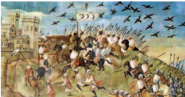
(Figura 1) La toma de Orán. Detalle de la pintura mural de Juan de Borgoña.