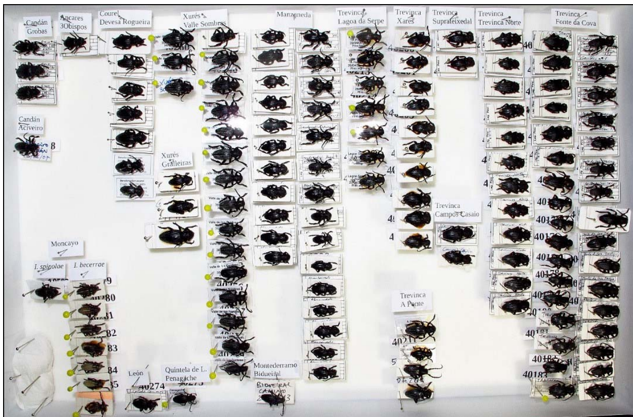
Fotografía 1. Ejemplares del género Iberodorcadion (Cerambycidae) depositados en el CIF de Lourizán.