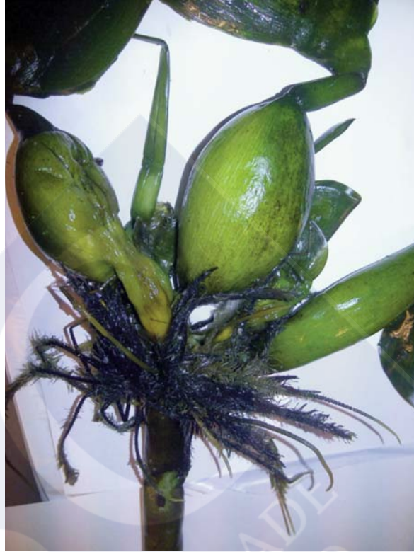
Figura 7.- Fotografía de Jacinto de Agua ( Eichhornia crassipes ) recuperados en la playa de As Rodas (Islas Cíes), dentro del Parque Nacional Marítimo – Terrestres das Illas Atlánticas de Galicia. Detalle de hojas flotantes, con hinchamientos en el peciolo