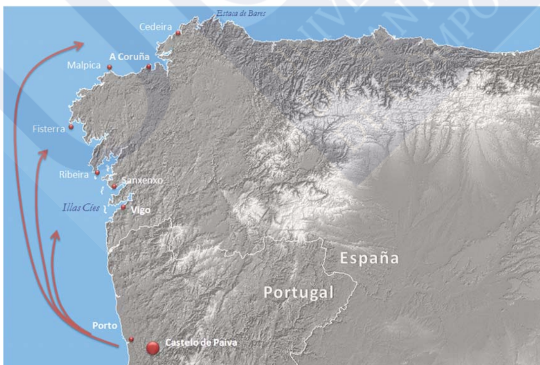
Figura 1.- Localización del territorio analizado y esquema del posible recorrido de los cuerpos de las víctimas del derrumbe del puente del río Douro hasta la costa de Galicia

Son plantas perennes con un tallo muy corto, de unos pocos centímetros, del que surgen grandes hojas dispuestas en roseta. Las hojas presentan largos peciolo y láminas circulares o más anchas que largas, de 2,5-16 cm de largo y 3-12 cm de ancho. En las hojas sumergidas, el peciolo es largo y cilíndrico, mientras que en las flotantes es más corto y se muestra muy hinchado, lo que facilita la flotabilidad de la planta (Fig. 2). De los nudos en la parte inferior del tallo surgen un conjunto de raíces de color marrón negruzco que llegan a alcanzar los 150 cm de longitud.