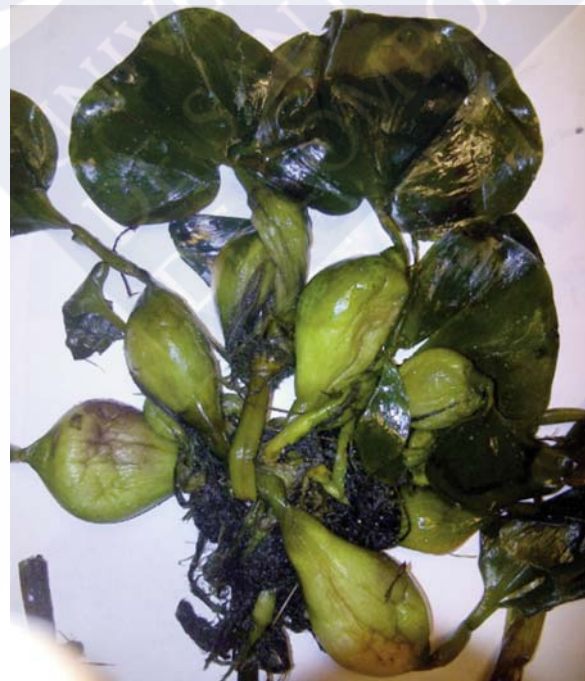
Figura 9.- Fotografía de Jacinto de Agua ( Eichhornia crassipes ) recuperados en la playa de As Rodas (Islas Cíes), dentro del Parque Nacional Marítimo – Terrestres das Illas Atlánticas de Galicia. Vista general de un individuo con hojas flotantes