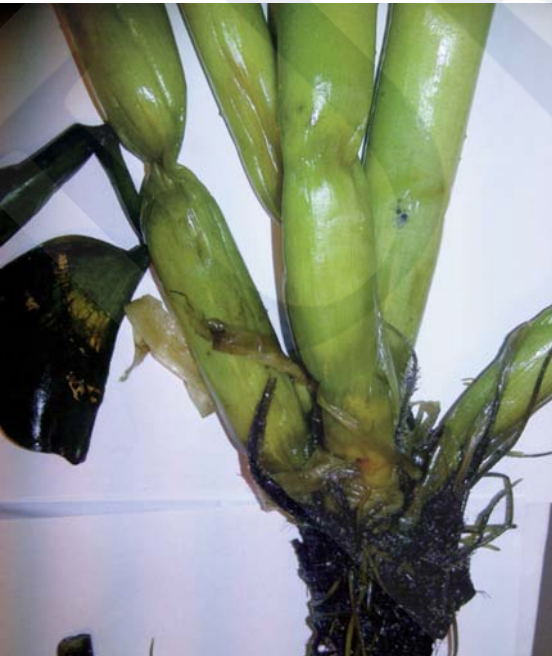
Figura 8.- Fotografía de Jacinto de Agua ( Eichhornia crassipes ) recuperados en la playa de As Rodas (Islas Cíes), dentro del Parque Nacional Marítimo – Terrestres das Illas Atlánticas de Galicia. Detalle de un individuo con hojas sumergidas carentes de hinchazones en los peciolo