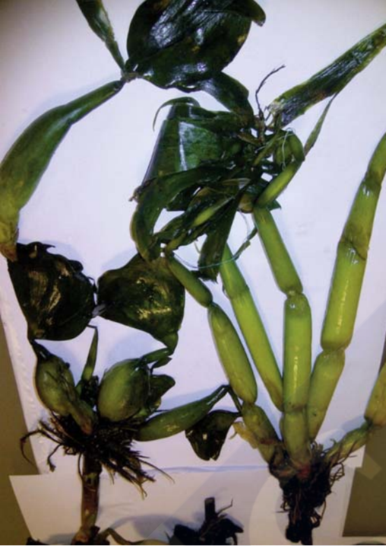
Figura 6.- Fotografía de Jacinto de Agua ( Eichhornia crassipes ) recuperados en la playa de As Rodas (Islas Cíes), dentro del Parque Nacional Marítimo – Terrestres das Illas Atlánticas de Galicia. Vista general de dos individuos