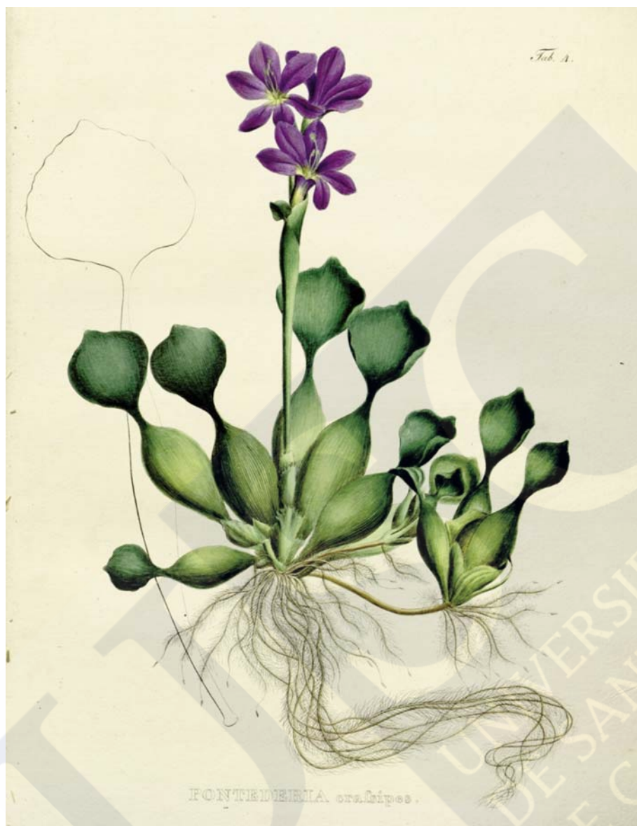
Figura 2. - Lámina de jacinto de agua ( Eichhornia crassipes ) publicada por von Martius en Nova Genera et Species Plantarum Brasiliensium (1823–1832)

Las flores de tonos azules a morados, raras veces blancas, alcanza los 5 cm y se asemejan en aspecto a la de los jacintos ( Hyacinthus L.). Se encuentran agrupadas en espigas conformadas por 4-16 flores. Cada flor posee 6 piezas, 3 externas y 3 internas que protegen los 6 estambres y un único pistilo. El fruto es una cápsula elíptica, de más o menos 1,5 cm de largo, con 3 ángulos. Las semillas numerosas, de poco más de 1 mm de largo, con 10 costillas longitudinales.