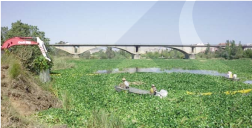
Figura 4.- Eliminación del Jacinto de Agua en el río Guadiana.

programa de actuación aplicado por los técnicos del parque, que consistió en la retirada manual de todas las plantas presentes (Sanz-Elorza et al. 2004). Posteriormente en el 2004 se constata su presencia en Badajoz en la cuenca del río Guadiana donde en pocos años llega a invadir, favorecido por las condiciones climáticas e hidrológicas, amplios tramos del curso fluvial. Las labores de mitigación del Jacinto de Agua en el Guadiana realizadas entre los años 2006-2012 ha supuesto un coste de 21.700.000 euros (Cifuentes, 2012). En el año 2012, los 20 operarios de la Confederación Hidrográfica, retiraron más de 2.000 toneladas, con una media de más de 35 toneladas por día (Fig. 4).