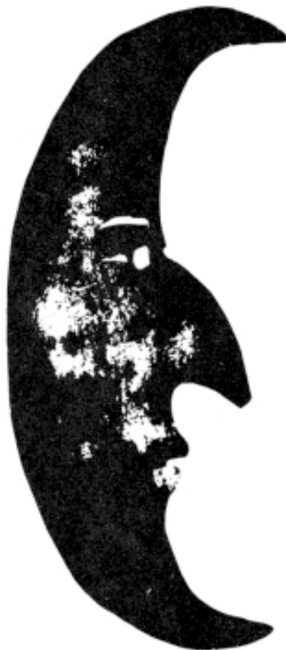
Hans Christian Andersen (Dinamarca 1805-1875), collage.

Como se puede apreciar, el presente número de NÓMADAS ofrece una serie de artículos de balance de los resultados empíricos, teóricos, metodológicos y de experiencia articulados con varias de las líneas y grupos de investigación del IESCO. Otro conjunto de artículos aborda diferentes temáticas que son nue-