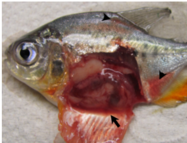
Figura 1. Animal inoculado intraperitonealmente con Aeromonas hydrophila , tratamiento 2. Nótese el líquido serosanguinolento en la cavidad abdominal (flecha) así como las hemorragias cutáneas a inmediatas a la inserción de las aletas anal y dorsal (cabezas de flecha).

A las 24 horas hubo mortalidad en todos los grupos, siendo esta mayor en los animales expuestos a Roundup®(GP) y a Roundup® más Cosmoflux® 411F (GPCF), comparada con el grupo control (T0). Al final de los 7 días la mortalidad fue del 100% (12/12) de los animales en los grupos expuestos al tóxico o a su mezcla, mientras que en el grupo control, la mortalidad fue solo del 50% (6/12) (Figura 2). Los animales sobrevivientes no evidenciaron signos clínicos de infección. No obstante, al examen de necropsia mostraron leve fluido serosanguinolento en la cavidad abdominal, así como congestión de las serosas. La bacteria pudo ser re-aislada de todos los animales experimentales.