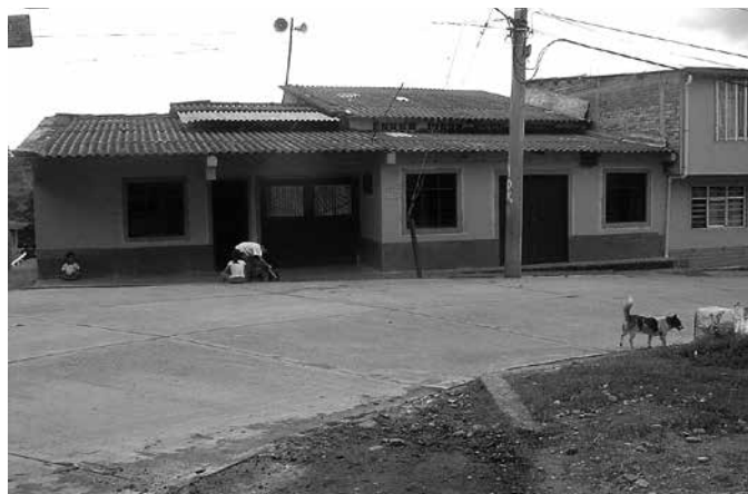
Foto 1. Barrio Solidaridad