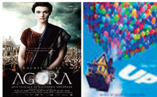
El año 2009 supuso un cierto alivio en el sector de de Exhibición y del Cine Español en general.